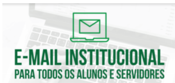
E-Mail Institucional UNIPAMPA