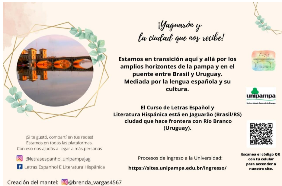
Figura 4: mantel de papel producido por la alumna