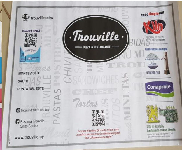
Figura 2: mantel de papel de Trouville

Para desarrollar esta etapa, seguimos los aportes de Análise dialógica do discurso (ADD) y las dos dimensiones propuestas por Acosta-Pereira (2014): dimensión contextual y verbo-visual.