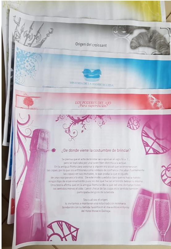
Figura 1: mantel de papel La Casona