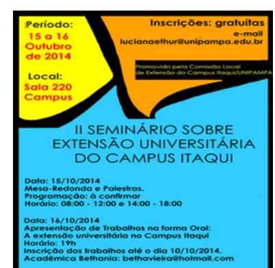
Cartaz de divulgação do evento.

19:15 – 21:30 – Relatos de trabalhos em extensão desenvolvidos no Campus Itaqui – Acadêmicos dos Cursos de graduação.