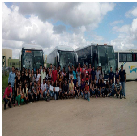
Alunos do campus Itaqui retornando.