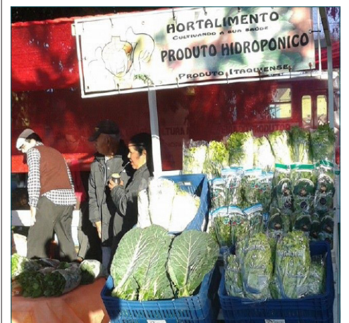
Produtos expostos na feira.