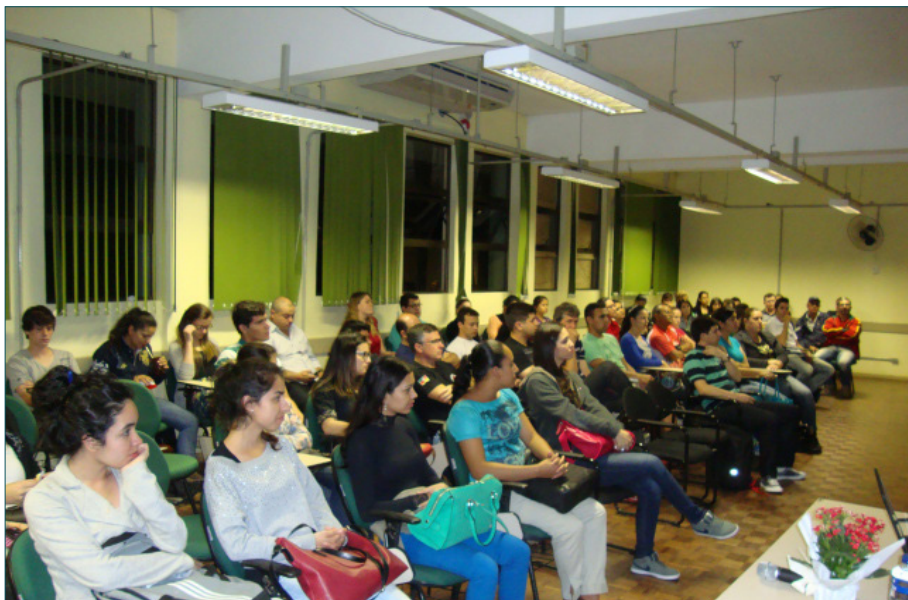
Público presente no evento.