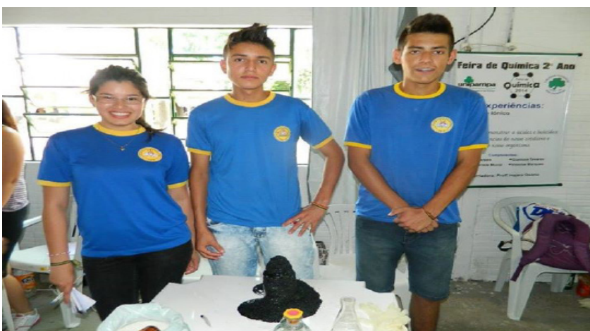
Alunos das escolas participantes.