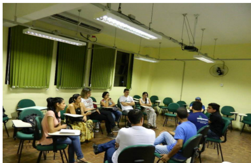
Ciclo do curso Bacharelado Interdisciplinar em Ciência e Tecnologia.