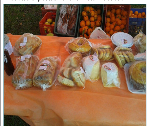
Produtos expostos na feira.