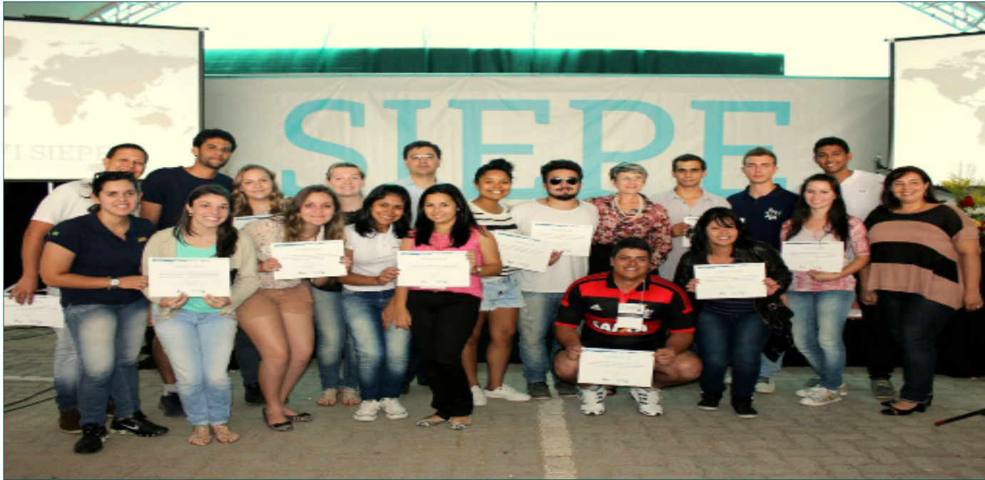
Alunos premiados ao final do VI SIEPE.