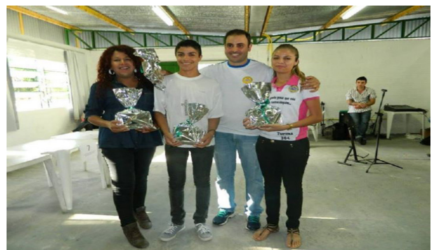
Alunos premiados.