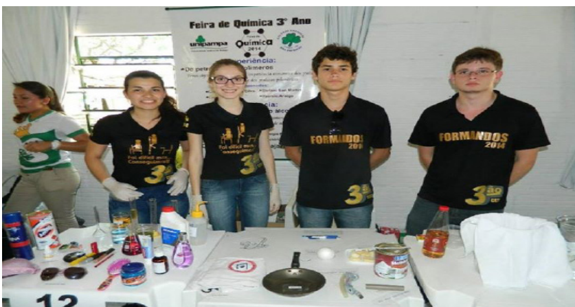
Alunos das escolas participantes.