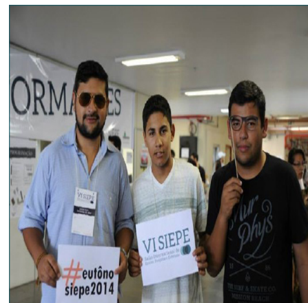
Alunos do Bict presentes no evento.