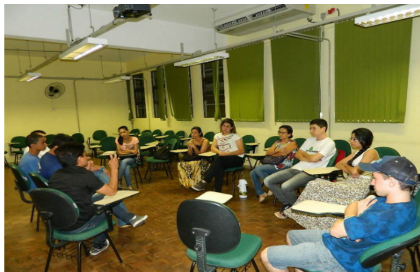
Ciclo do curso Bacharelado Interdisciplinar em Ciência e Tecnologia.