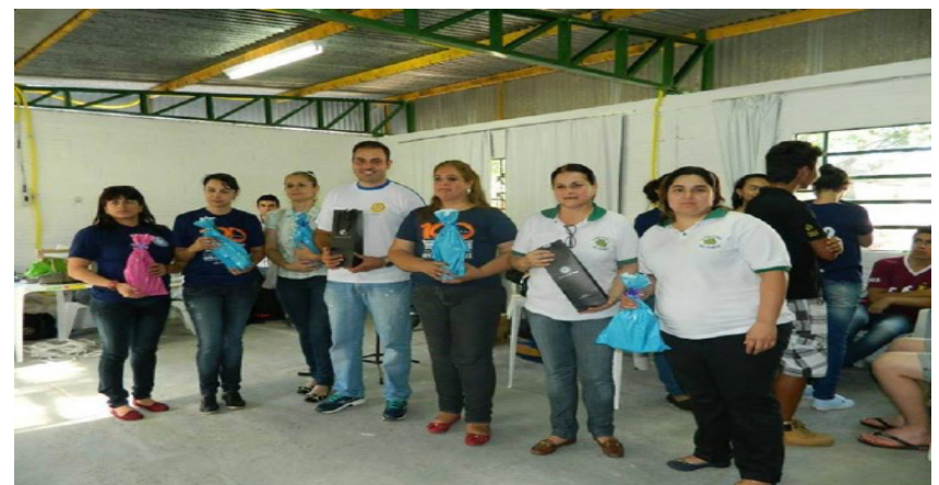
Alunos premiados.