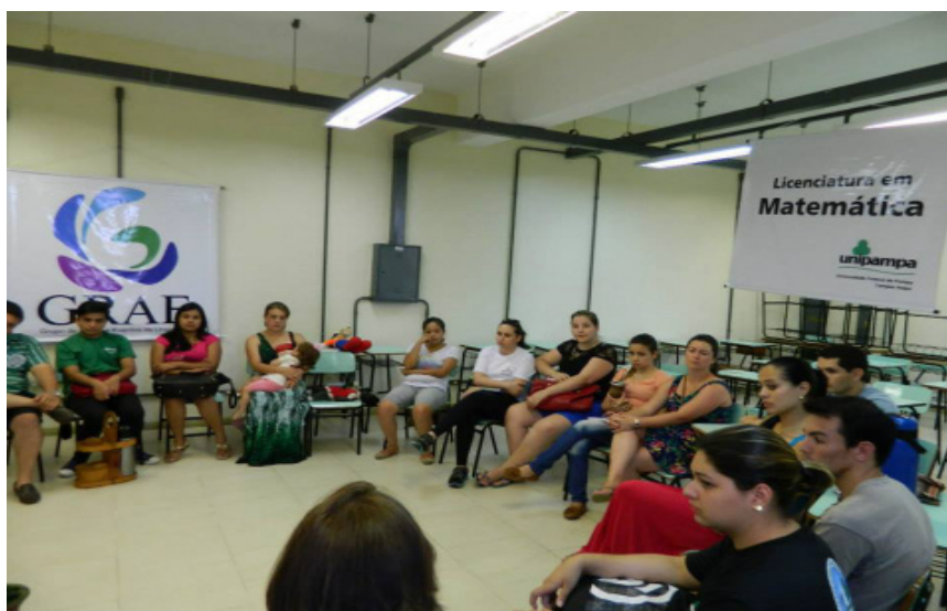
Ciclo do curso Matemática - Licenciatura.