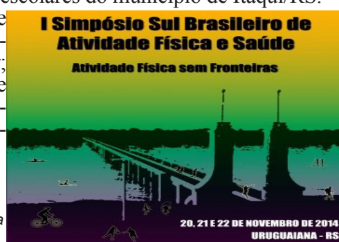
Cartaz de divulgação do evento.