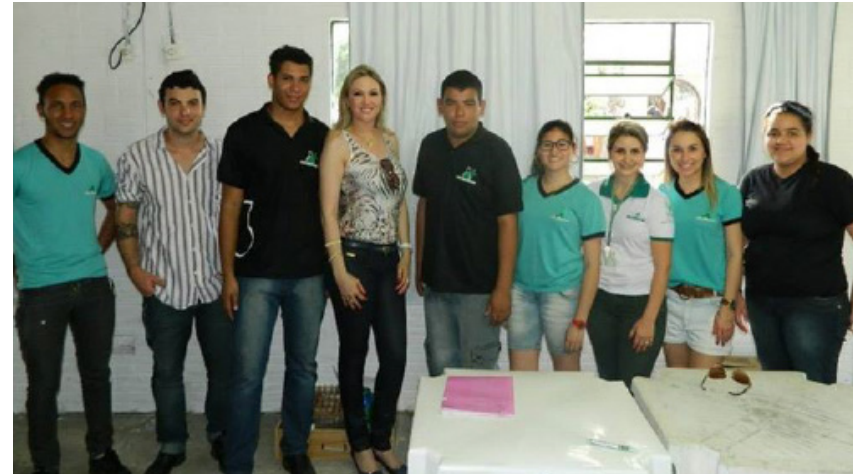
Comissão organizadora da feira.

Simulador de Bafômetro – 3º Ano- Escola Odila Villor de Moraes