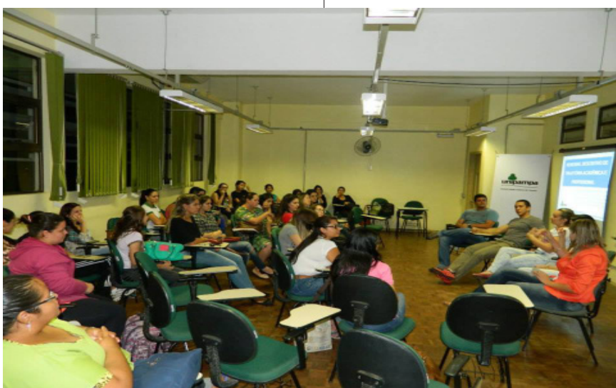
Ciclo do curso de Nutrição.