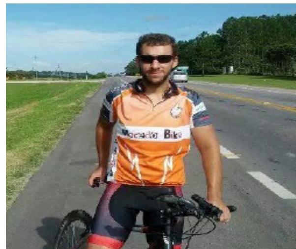
Rafael Kurtz, organizador do evento.

Agrademos ao Rafael Kurtz Alves por ceder essa entrevista e por nos proporcionar um evento desse porte para a comunidade itaquiense. Precisamos de pessoas assim, com iniciativas e propostas para melhorar a cidade de Itaqui.