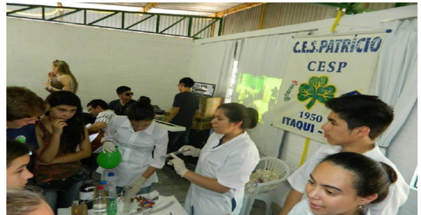
Alunos das escolas participantes.