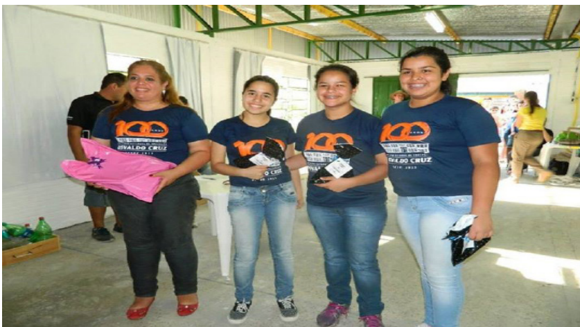
Alunos premiados.