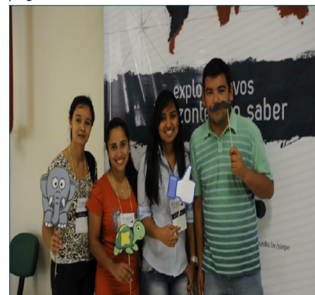
Alunos do Bict presentes no evento.