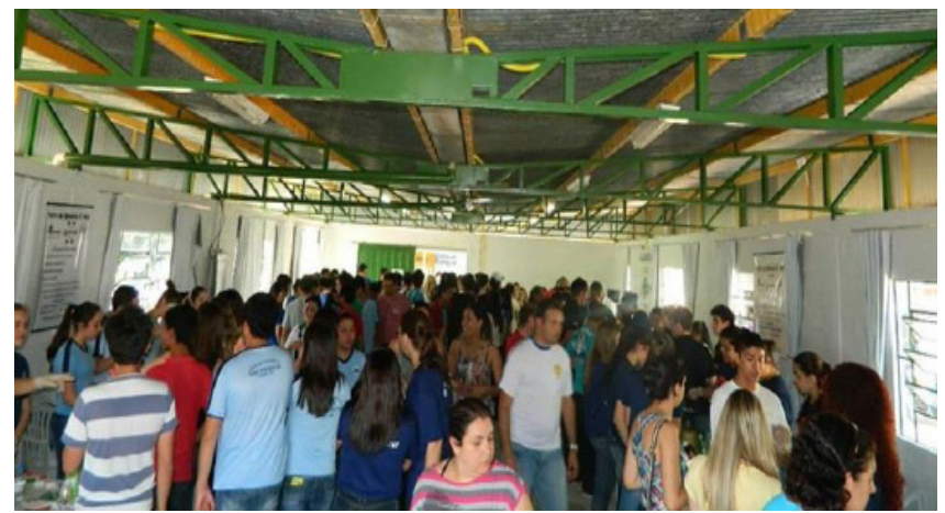
Público presente no evento.