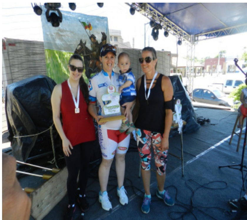
Campeãs da Categoria Feminina.

O ciclismo, além de ser uma alternativa de mobilidade urbana, uma vez que podemos utilizar uma bicicleta para nos deslocarmos dentro da cidade ao invés de veículos automotores,