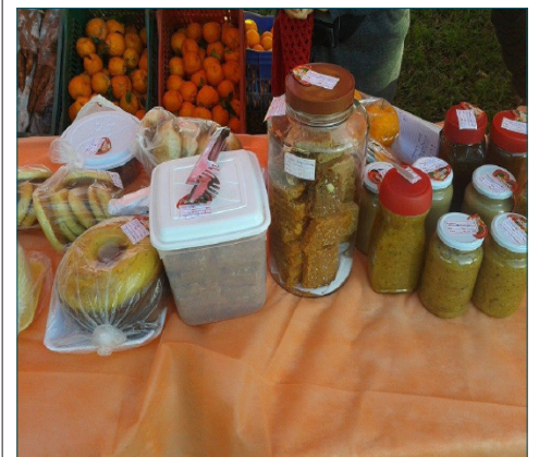
Produtos expostos na feira.