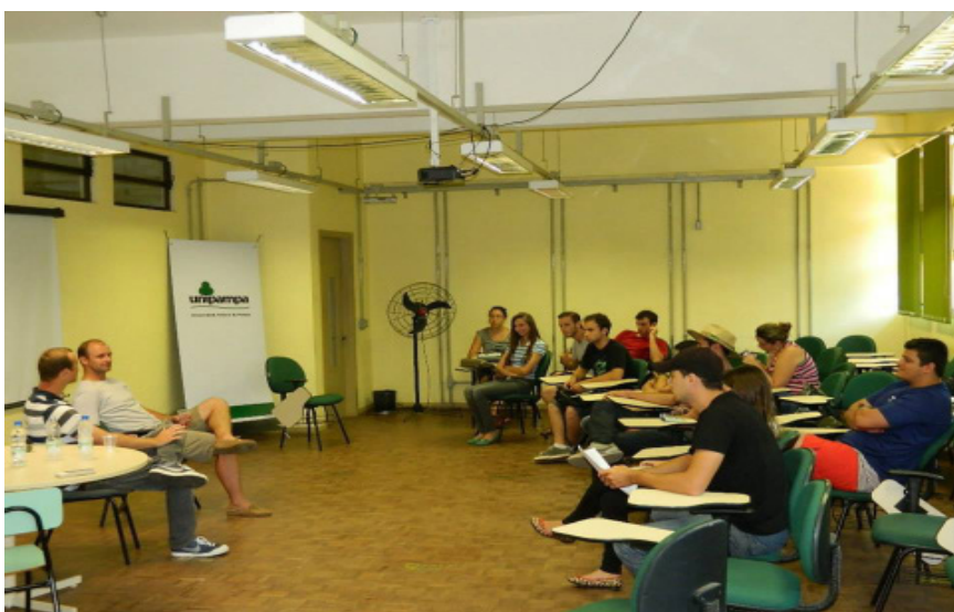
Ciclo do curso de Agronomia.