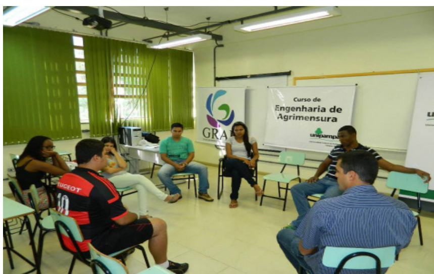
Ciclo do curso de Engenharia de Angrimensura.