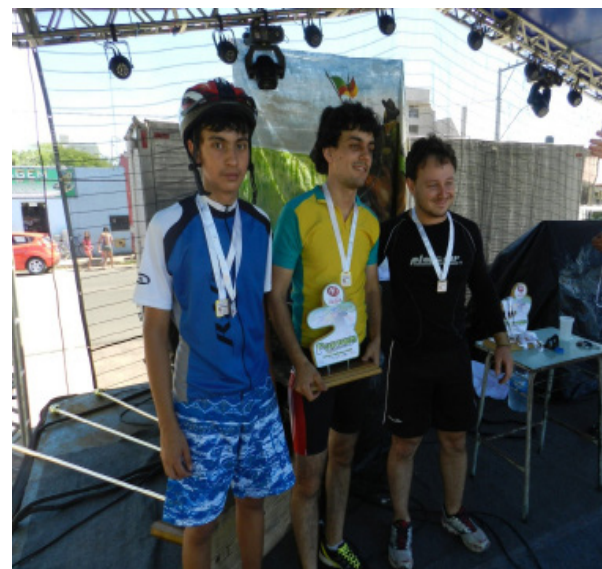
Campeões da Categoria Amador.