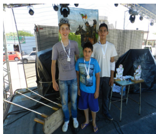
Campeões da Categoria Cross.