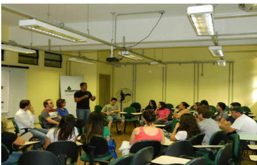
Ciclo do curso de Ciência e Tecnologia de Alimentos.