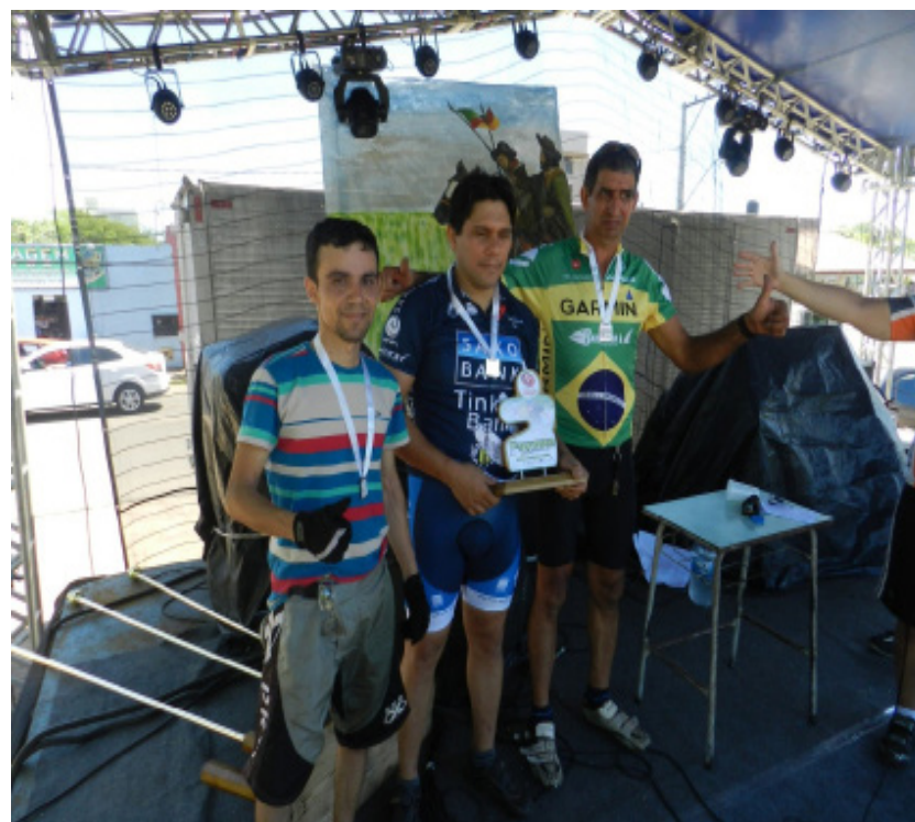
Campeões da Categoria Profissional.