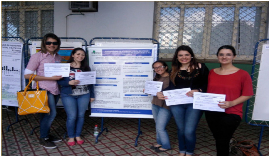
Alunos do campus que participaram do evento.