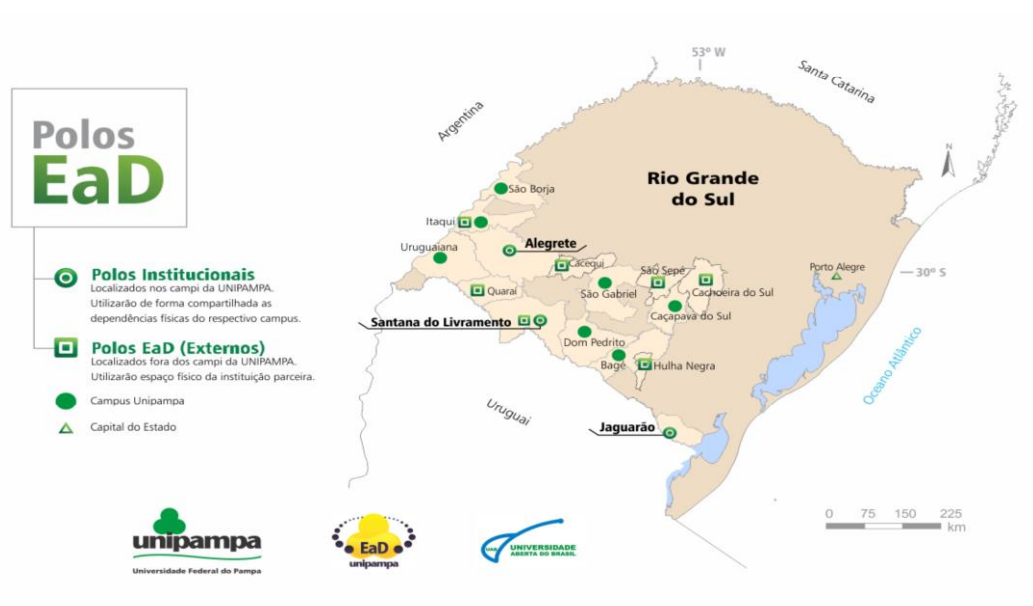
Figura 1 - Polos Unipampa e UAB/Unipampa