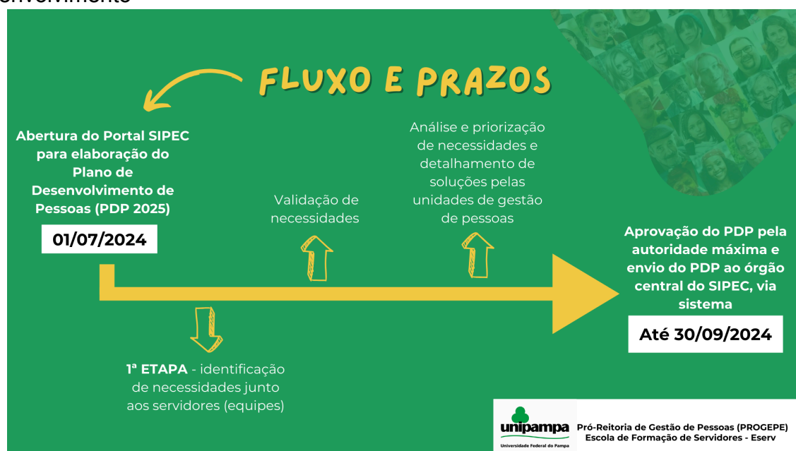
Figura 1 - Fluxo e prazos para o diagnóstico das Necessidades de Desenvolvimento