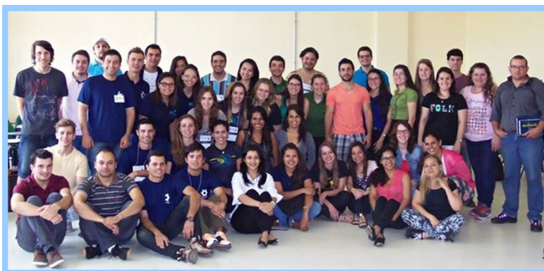
Reunião Momento PET