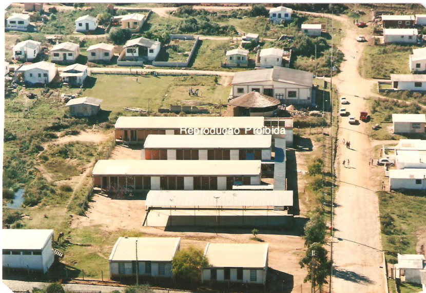
Figura 5 - Visão aérea da escola