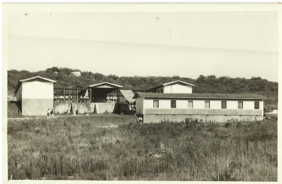
Figura 2 - Prédio próximo a Brigada Militar 2