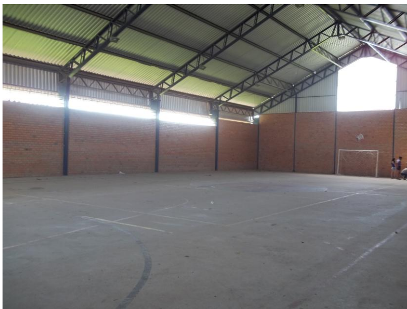
Figura 10 - Ginásio

Espaço destinado à prática de esportes dos alunos da escola, onde sabemos de sua grande importância no desenvolvimento do aluno em sala de aula.