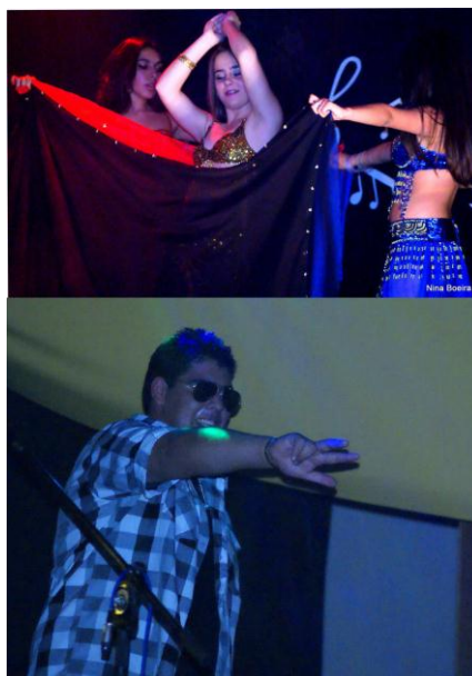
Figura 17 - Show de Talentos

Os alunos mostram os seus dons como danças e apresentação de bandas.