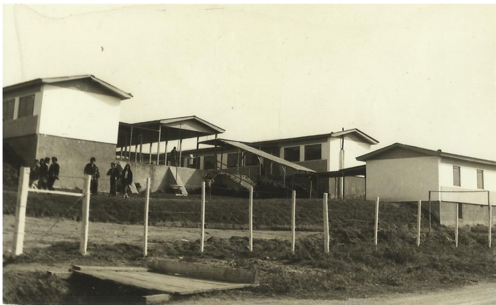
Figura 1 - Prédio próximo a Brigada Militar

Em 1964 passa a chamar-se Escola Normal Regional Dr. Bulcão e passa a funcionar em novo prédio (próximo à Brigada Militar).