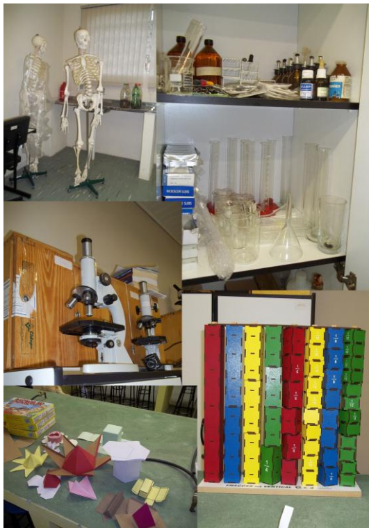
Figura 8 - Laboratório De Ciências Da Natureza

As atividades no Laboratório incentivam o aluno a conhecer, entender e aprender a aplicar a teoria na prática, dominando as ferramentas e as técnicas utilizadas em pesquisas científicas.