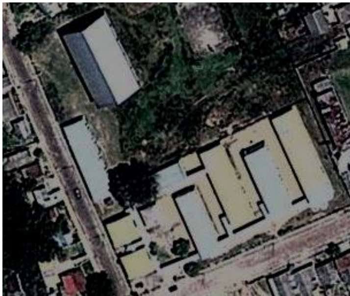
Figura 7 - Visão aérea atual