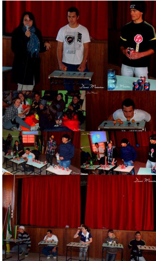
Figura 15 - Gincana

Uma atividade interdisciplinar que visa na realização de tarefas integrando as diversas disciplinas juntamente com a criatividade, interação em grupo, disciplina, oralidade, etc.