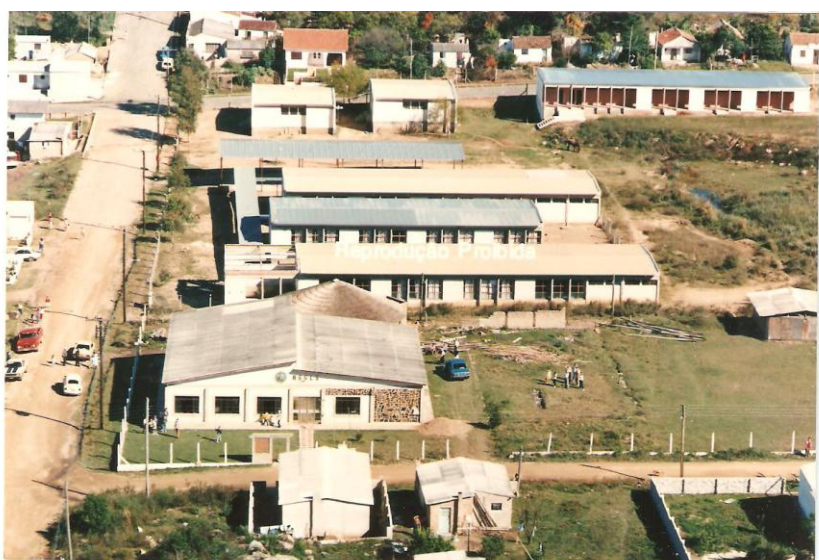
Figura 6 - Visão aérea da escola 2