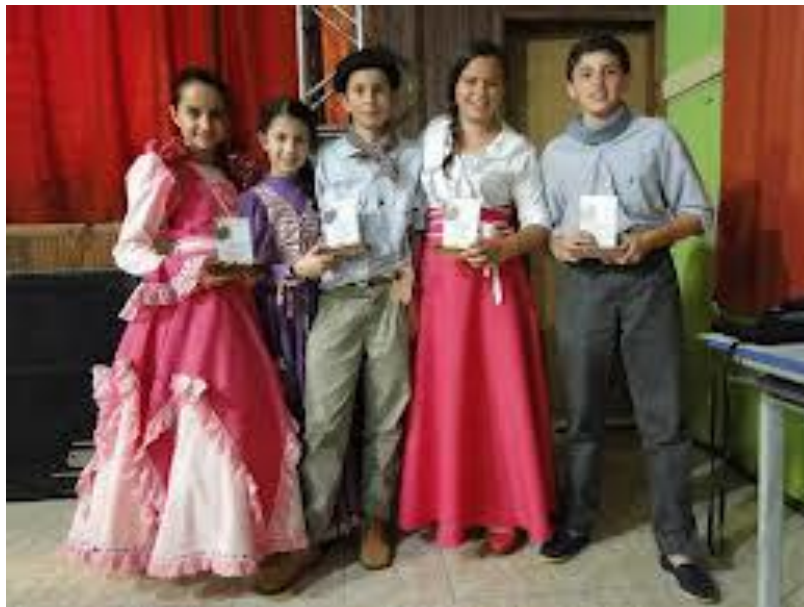
Figura 16 - Vencedores do Festival Nativista