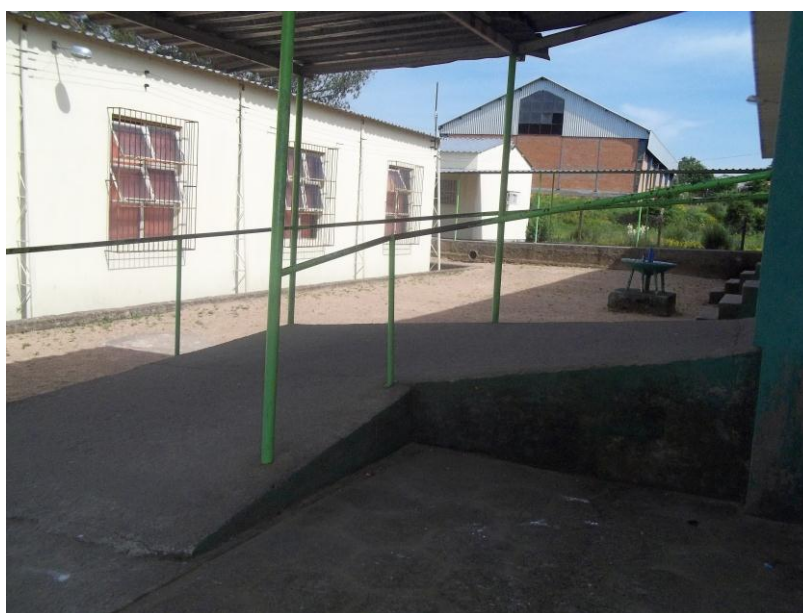
Figura 13 - Rampa para acesso ao pavilhão

A escola dispõe apenas de um pavilhão com rampa para acesso a sala de aula e banheiro adaptado, também de rampas para seu acesso da entrada principal.