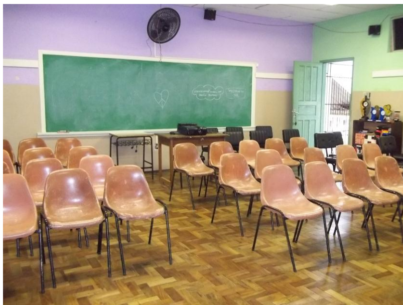
Figura 12 - Sala Audiovisual