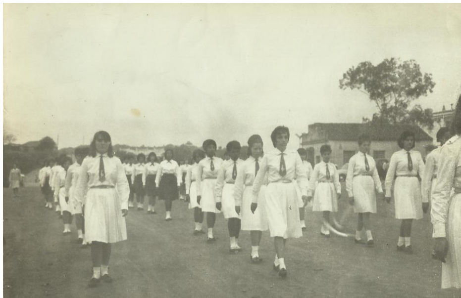
Figura 3 - Desfile de 9 de maio de 1965

Em 1984 nossa escola passou a denominar-se Escola Estadual de 1º e 2º Graus Dr. Bulcão. A partir de 07/03/2001 a denominação Instituto Estadual de Educação Dr. Bulcão passou a vigorar.