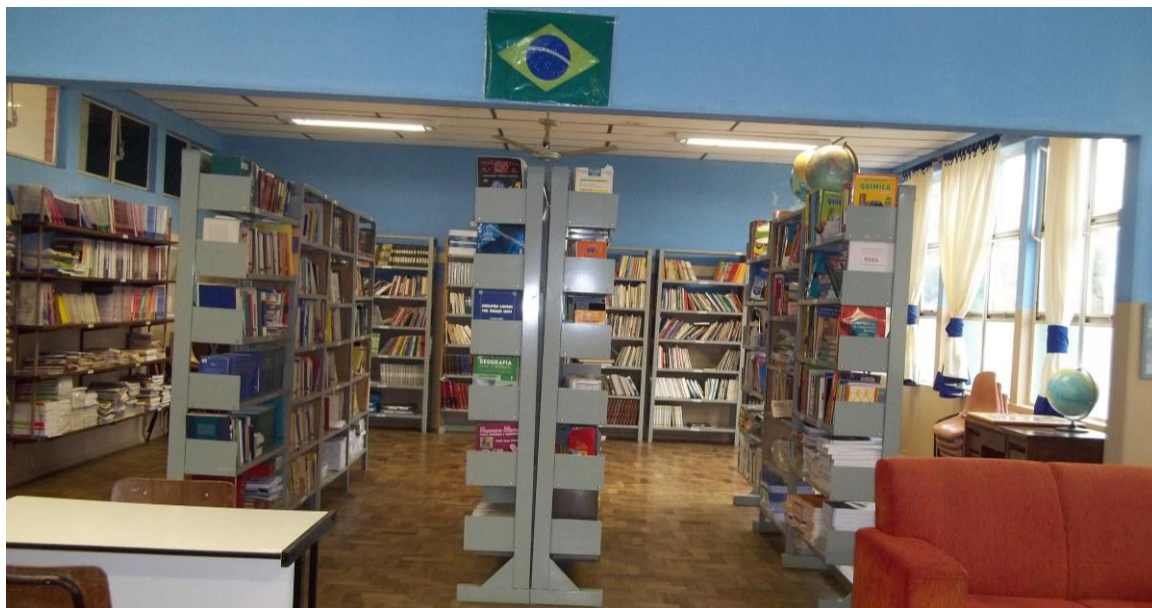
Figura 11 - Biblioteca

Agrega também como finalidade difundir a informação como cultura e oportunizar o acesso a todas as formas de registro e meios de divulgação do conhecimento: livros, documentos, jornais, revistas, dentre outros, com vista à pesquisa, a produção textual crítica e ao prazer da leitura, de forma dinâmica, criativa, viva e envolvente.