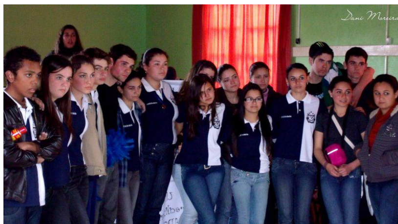
Figura 14 - Alunos

A indisciplina escolar é um dos maiores fatores que prejudica na aprendizagem do aluno esse tema e outros são tratados na forma de palestras.