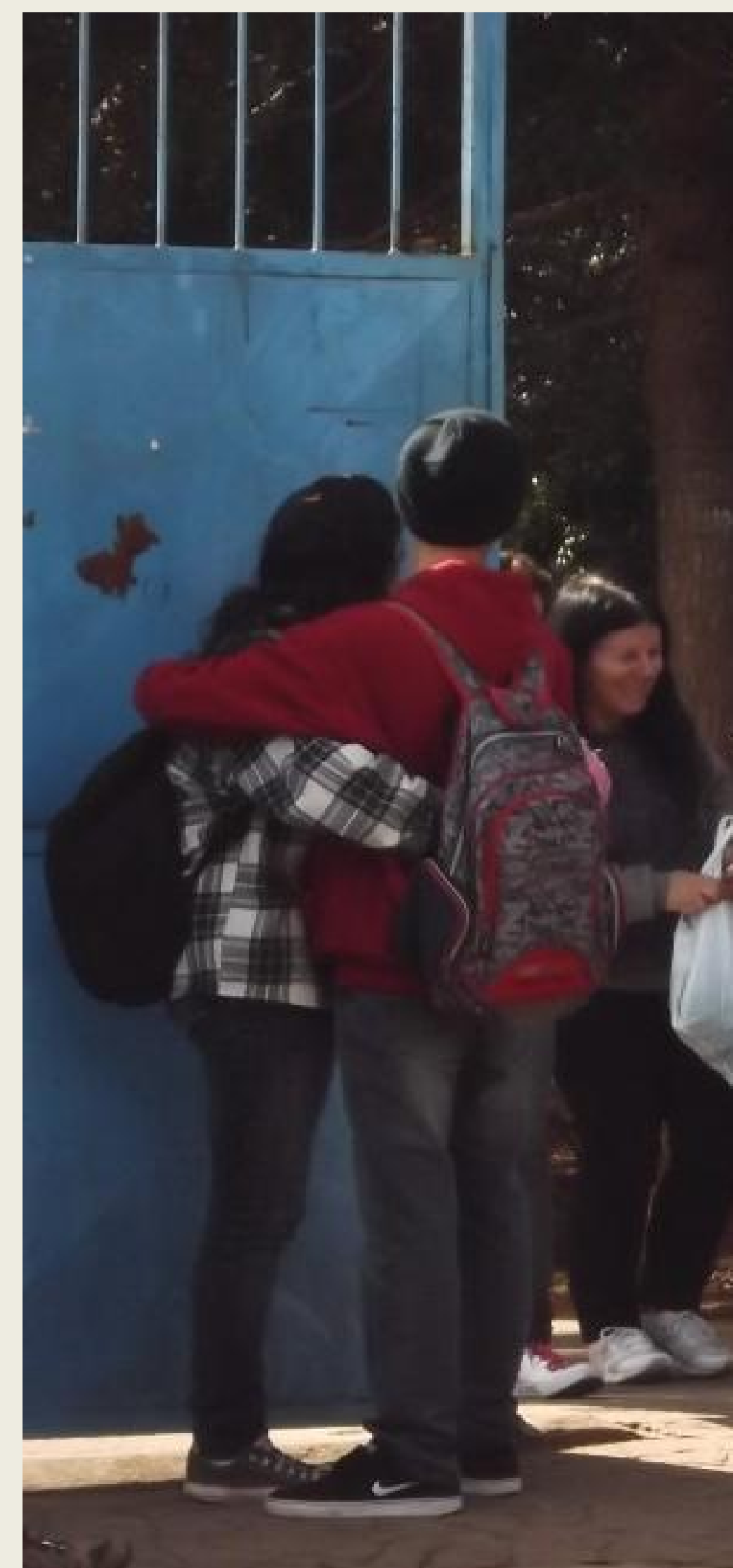
Fig -1. Namoro de adolescentes na saída da escola.

Diante disso, foi possível constatar que a utilização do Método Paulo Freire foi de grande significância para o aperfeiçoamento profissional dos bolsistas do PIBID. A aplicação do Método Paulo Freire possibilitou a ampliação dos olhares para além dos muros da escola, levando à proposição de atividades que são mais significativas aos alunos, pois são voltados a sua realidade e a forma como os mesmos agem e se relacionam.