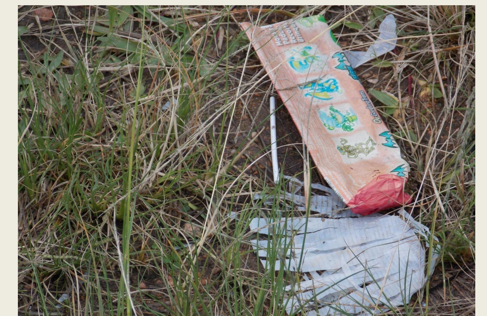
Fig - 3. Descarte incorreto do lixo feito por alunos ao redor da escola.