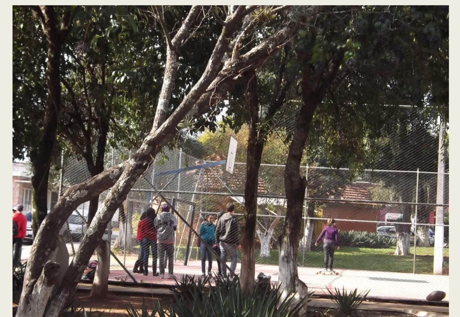
Fig - 2. Encontro de alunos após as aulas e o uso do skate.