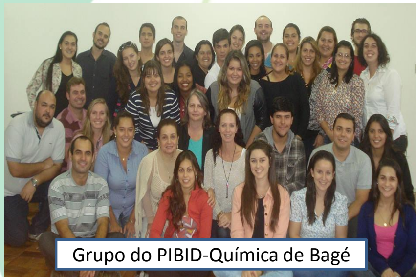
Grupo do PIBID-Química de Bagé

Resultados: Ao pensarem em propostas metodológicas alternativas cada professor supervisor com o seu grupo de bolsistas passaram a pensar em o que, e como desenvolver essas propostas metodológicas na sala de aula da Educação Básica.