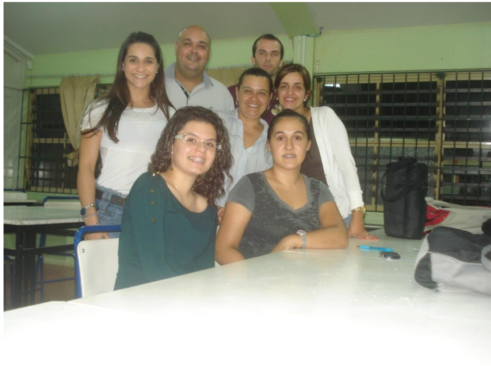
1º Reunião e apresentação do grupo ao colégio

Os bolsistas se apresentaram e começaram suas atividades no colégio no dia 17/3/2014, porém o colégio estava em reforma, portanto no período de em torno e meses os bolsistas observaram minhas aulas e estudaram e escreveram o projeto que norteia as atividades que serão desenvolvidas durante esse ano no colégio, que é: Horta Orgânica Escolar