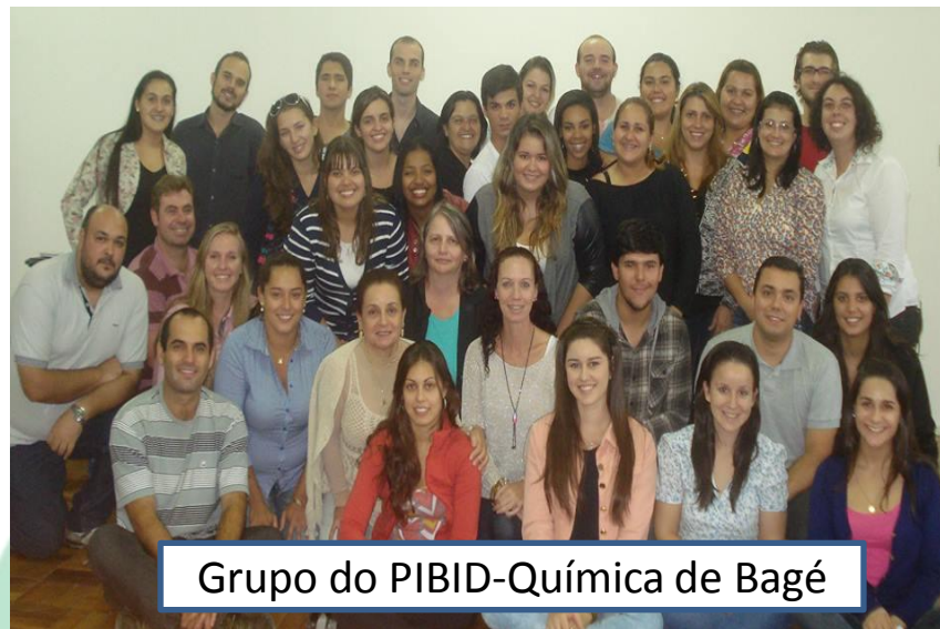
Grupo do PIBID-Química de Bagé

Mostrar as atribuições de cada bolsista ou supervisor, as ações e metas do projeto.