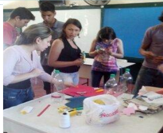
Confecção do alimentador e bebedouro para pássaros

Importância das espécies na cadeia alimentar, salientando as funções que as espécies desempenham.