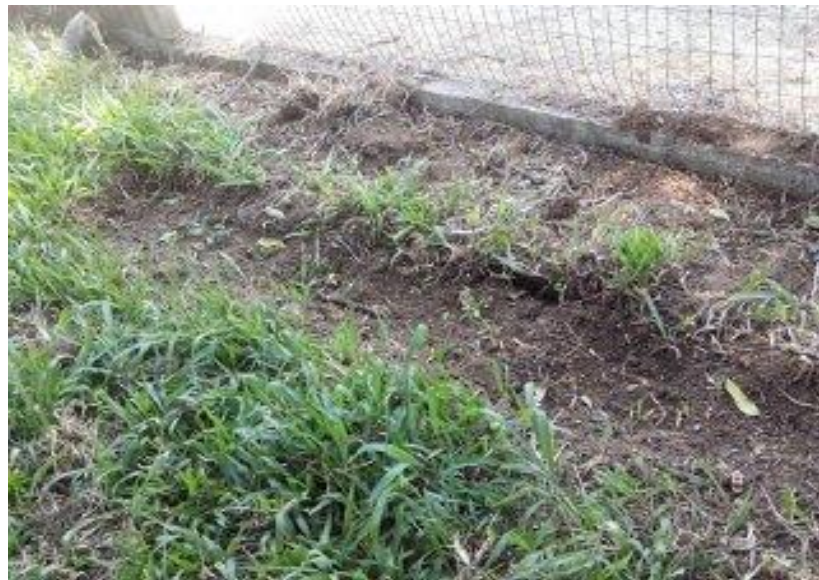
Plantio de mudas