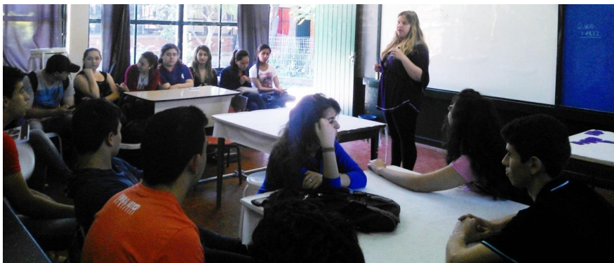
Figura 2. Bolsista desenvolvendo a atividade com a turma 301.