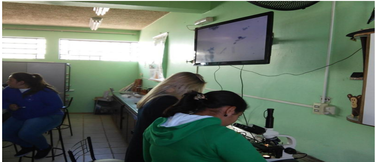
Figura 02: Alunos realizando montagem do material para observação