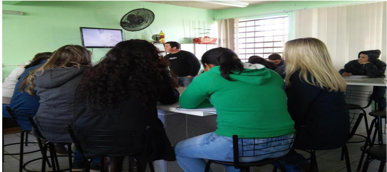
Figura 01: Alunos acompanhando explicações

Atividade realizada com 3º ano do Ens. Médio.