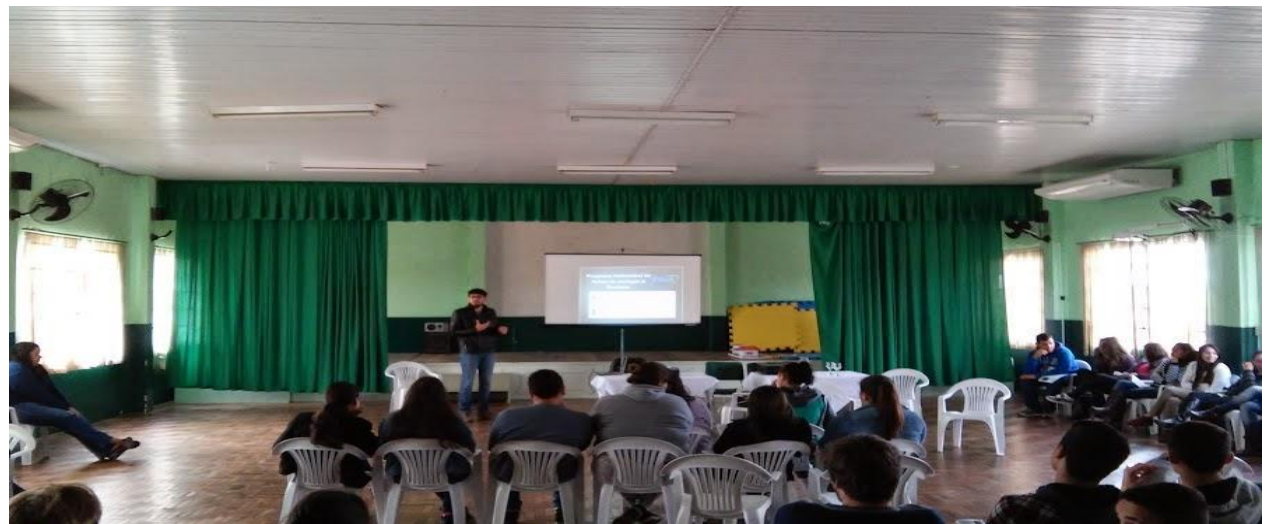
Figura 04: Bolsista explicando a importância dos programas de pesquisa