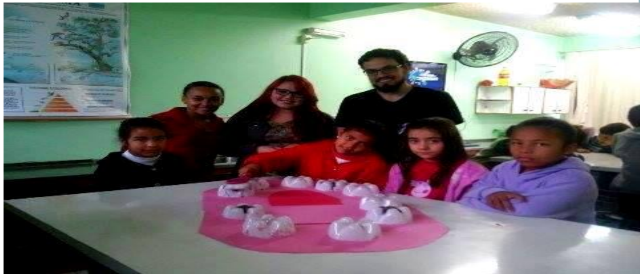
Figura 05: Bosistas e alunos envolvidos na atividade.