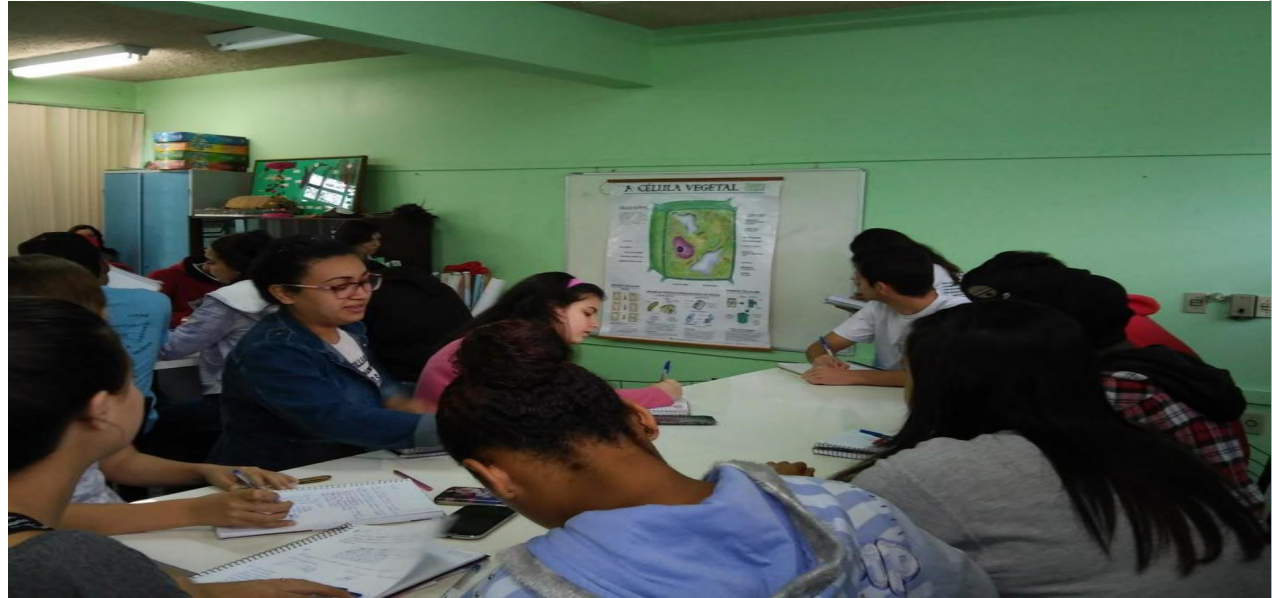
Figura 01: Alunos anotando partes da célula vegetal

A prática realizada com o 1º ano do Ens. Médio. Identificar e observar a estrutura da célula vegetal, criando conceitos.