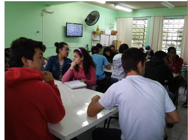
Figura 03: Alunos acompanhado as explicações