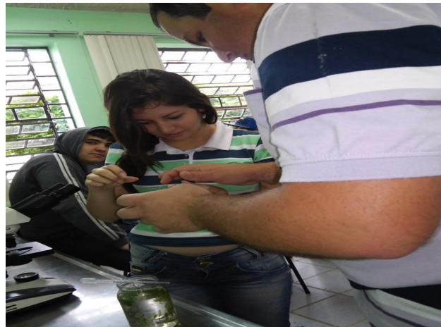
Figura 02: Realizando montagem do material