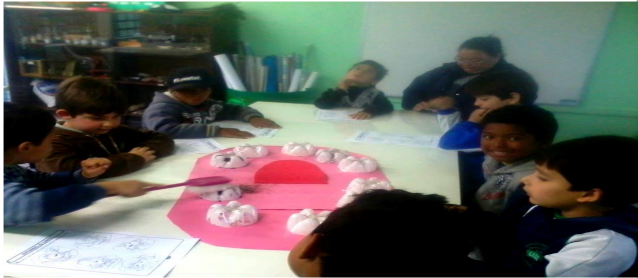
Figura 04: Alunos, realizando a escovação dos dentes

A atividade teve como objetivo entender as funções dos dentes, conhecer uma das principais doenças bucais: a cárie e aprender a maneira correta de escovar os dentes