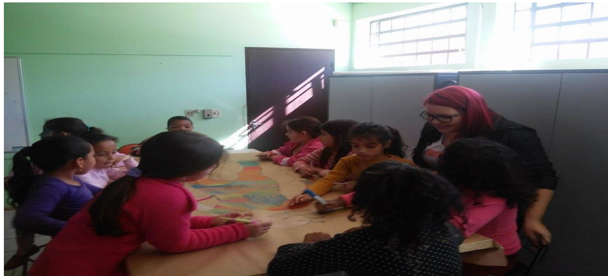
Figura 05: Bolsista conduzindo as atividades com alunos

Com objetivo de ajudar os alunos a perceber o corpo como um todo integrado, em que diversos sistemas realizam funções específicas, e que interagem para garantir a sua manutenção. A atividade foi realizada com a turma de 2º ano do Ens. Fundamental.