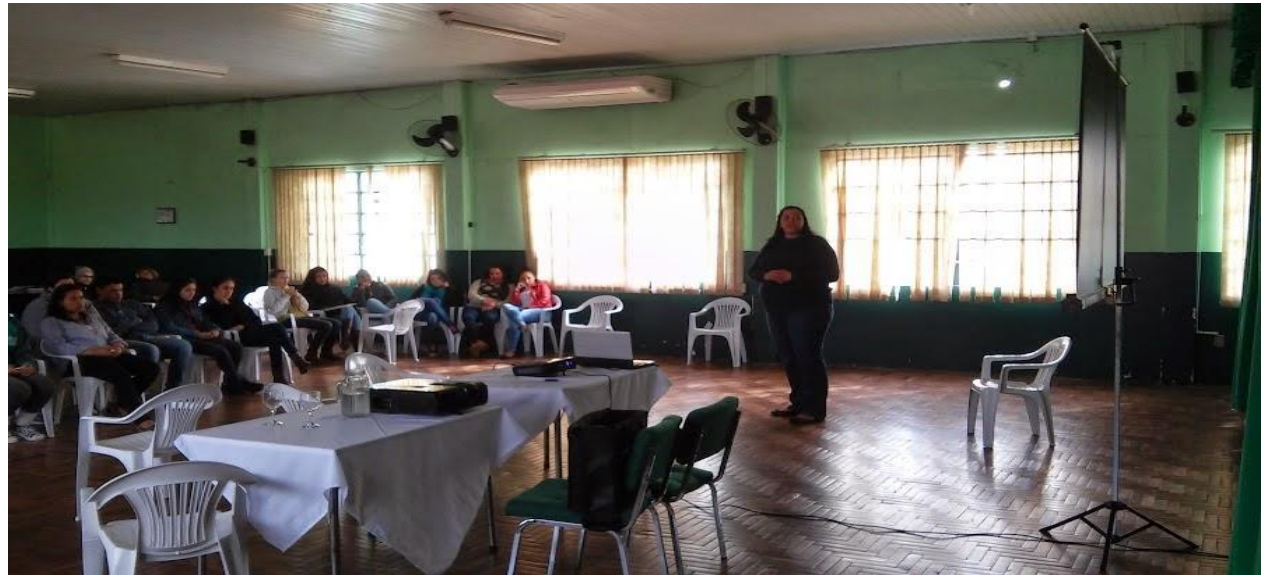
Figura 03: Bolsista comentando sobre áreas de atuação do Biólogo

A palestra teve objetivo de mostrar um pouco dessa profissão, suas áreas de atuação tanto na licenciatura quanto no bacharelado, mercado de trabalho de um Biólogo e relatos dos bolsistas sobre programas de bolsa para pesquisa e incentivo a permanência. Palestra proferida aos alunos de Ens. Médio