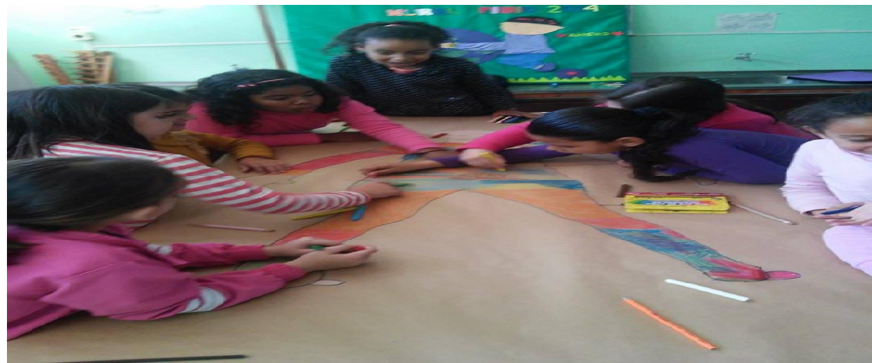
Figura 06: Alunos se divertindo na atividade, com a pintura e aprendizado.