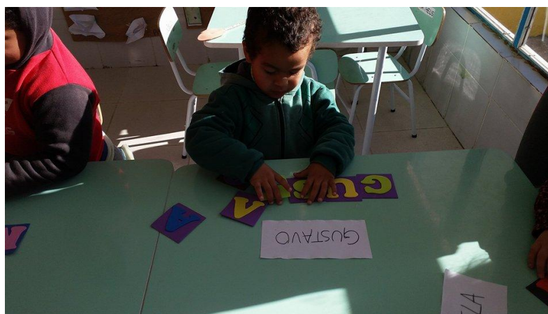
Figura 2. Registro de atividade da bolsista no Pibid. (2017).

Já na seguinte imagem é possível perceber que já compreendo que o trabalho na Educação Infantil não deve ser tão mecânico, ou seja, já pratico um discurso que vise a inserção, de maneira sistemática das crianças com o mundo da leitura e da escrita. Brandão e Leal (2011, p.28) enfatizam que “é possível aprender sobre as letras por meio de jogos e atividades bastante diversificadas”, sem que recorra somente a repetição da sua escrita