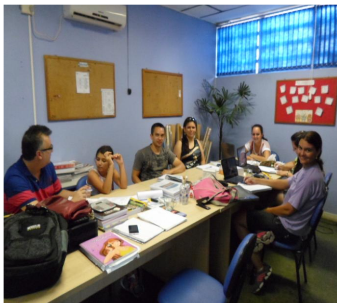
Visita do nosso coordenador

Os trabalhos do mês de Janeiro foram feitas na segunda semana de 06/01 a 12/01.