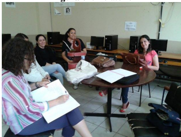
Figura 01: Relatório