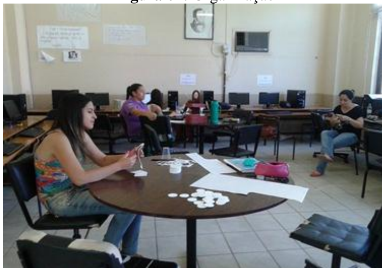
Figura 04: Organização