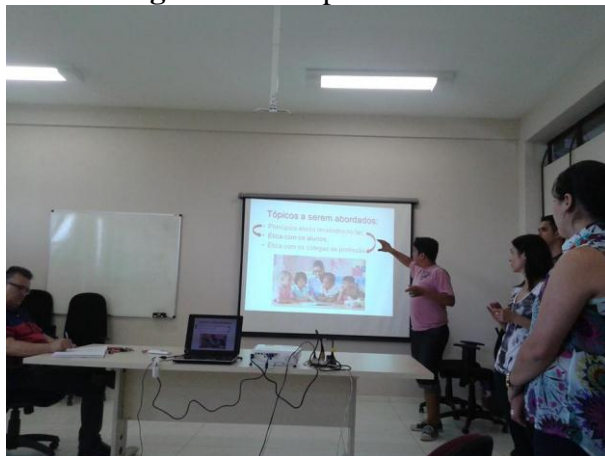
Figura 02: Grupo de estudos