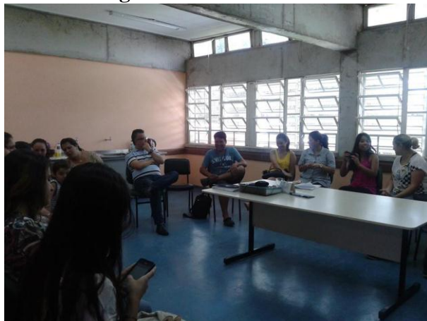
Figura 06: Reunião Geral