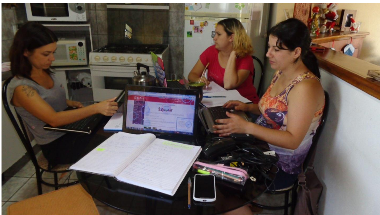
Organizamos o cronograma das atividades para 2015.