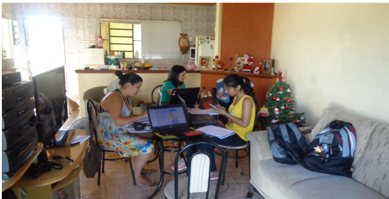
Continuamos trabalhando na montagem da Oficina sobre "Composição Química das Células".