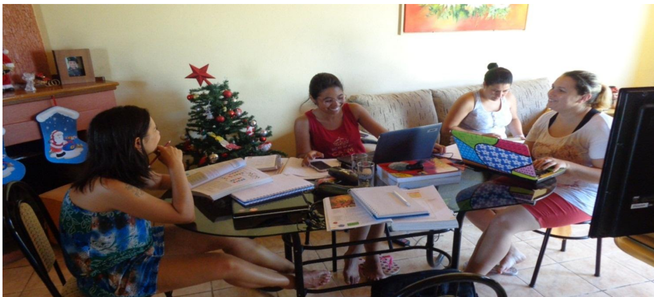
Reunião com coordenador e finalização da Oficina sobre "Composição Química das Células".