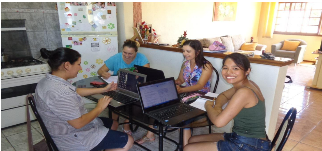
Planejamento e montagem da Oficina sobre "Composição Química das Células".