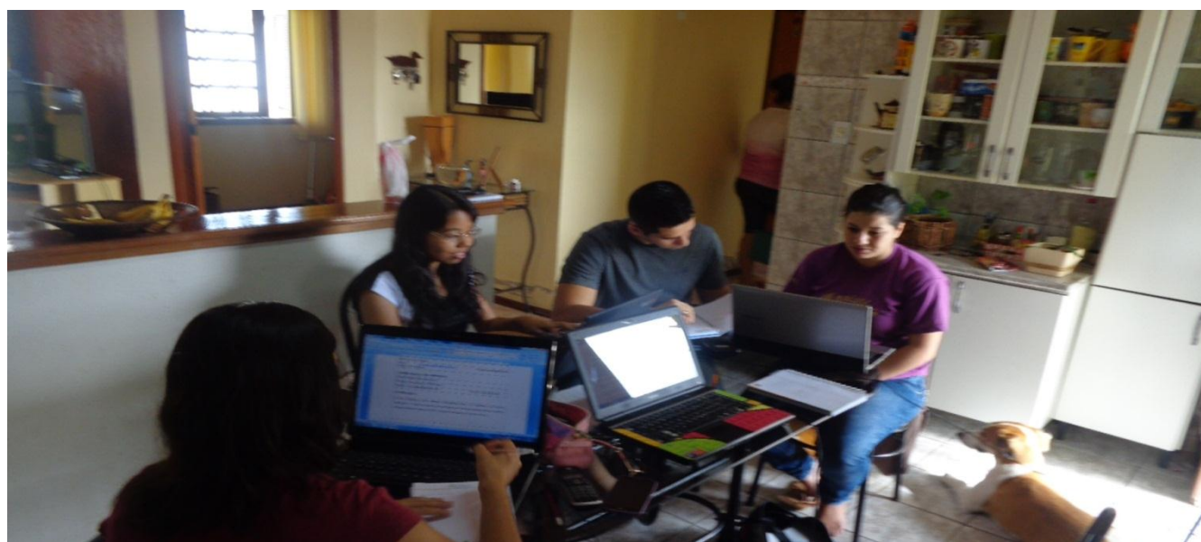
Trabalhamos na criação do blog "Patrolando as Ciências" e na construção da oficina sobre "Power Point".