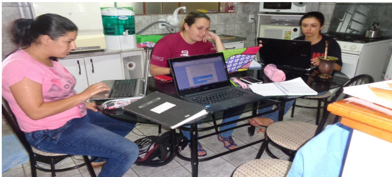
Construção do Portfólio de 2014.