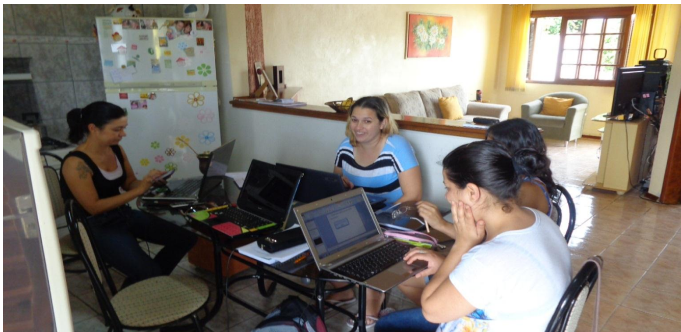
Trabalhamos no planejamento da oficina sobre "Resumos Científicos".