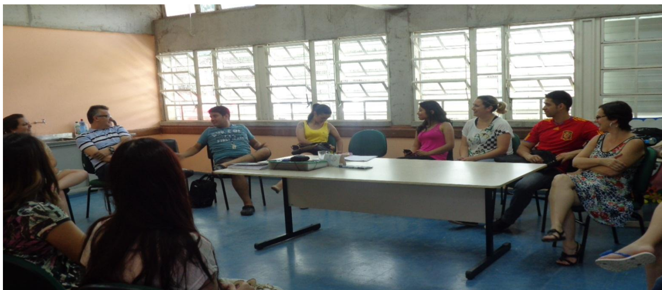
Reunião Geral na E.E.E.F Getúlio Dornelles Vargas-CIEP.