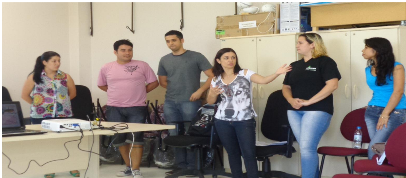
Apresentação do Tema Ética na Docência.