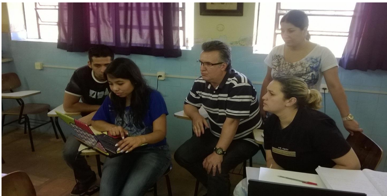
Conversamos sobre o Intra-Pibib.