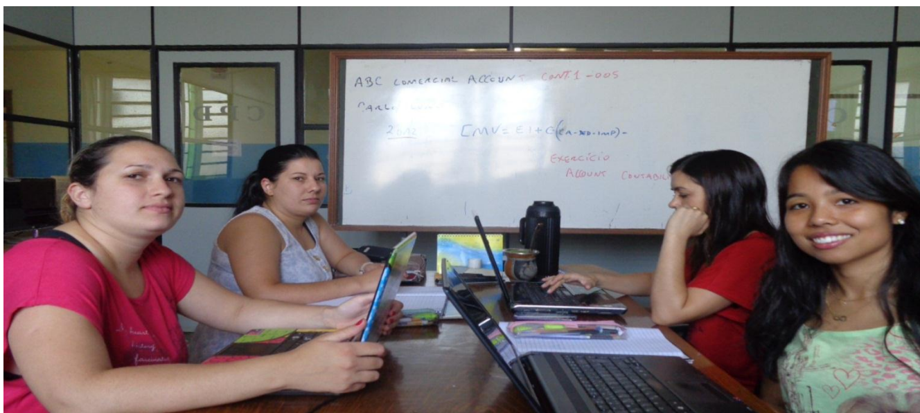
Continuamos a trabalhar na Oficina sobre Ética na Docência.