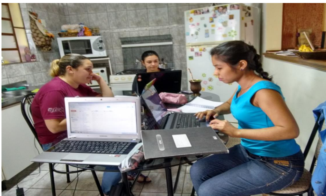
Construção do portfólio 2014.