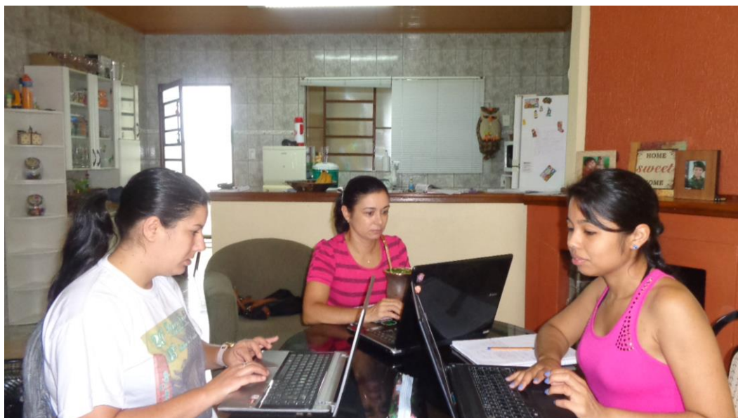
Digitação da oficina e calendário anual.