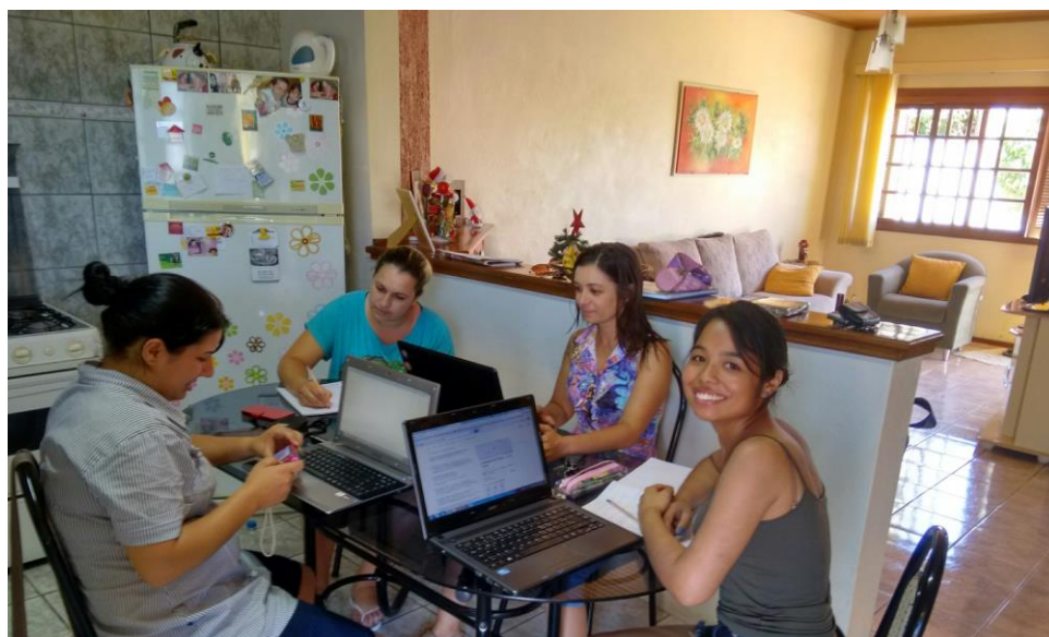
Planejamento da oficina “Composição Química da Célula”.