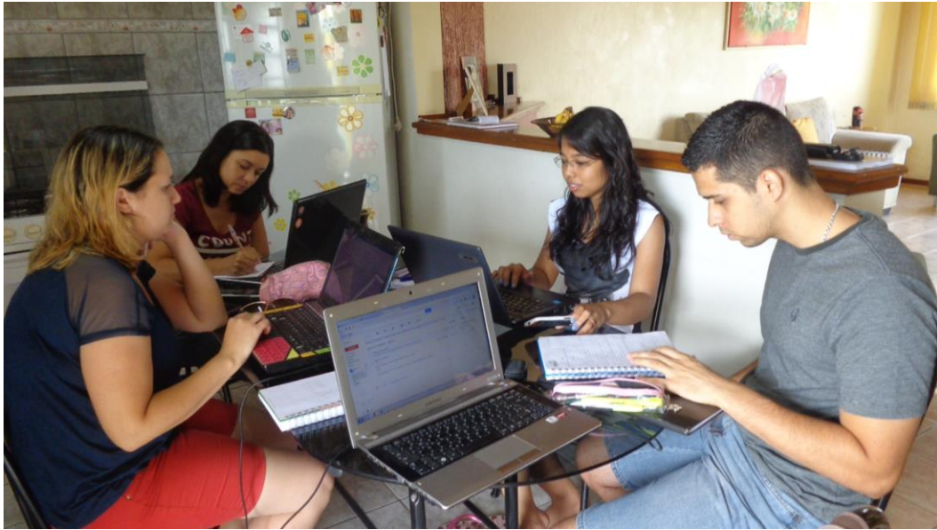
Organização da oficina sobre “Power Point”.