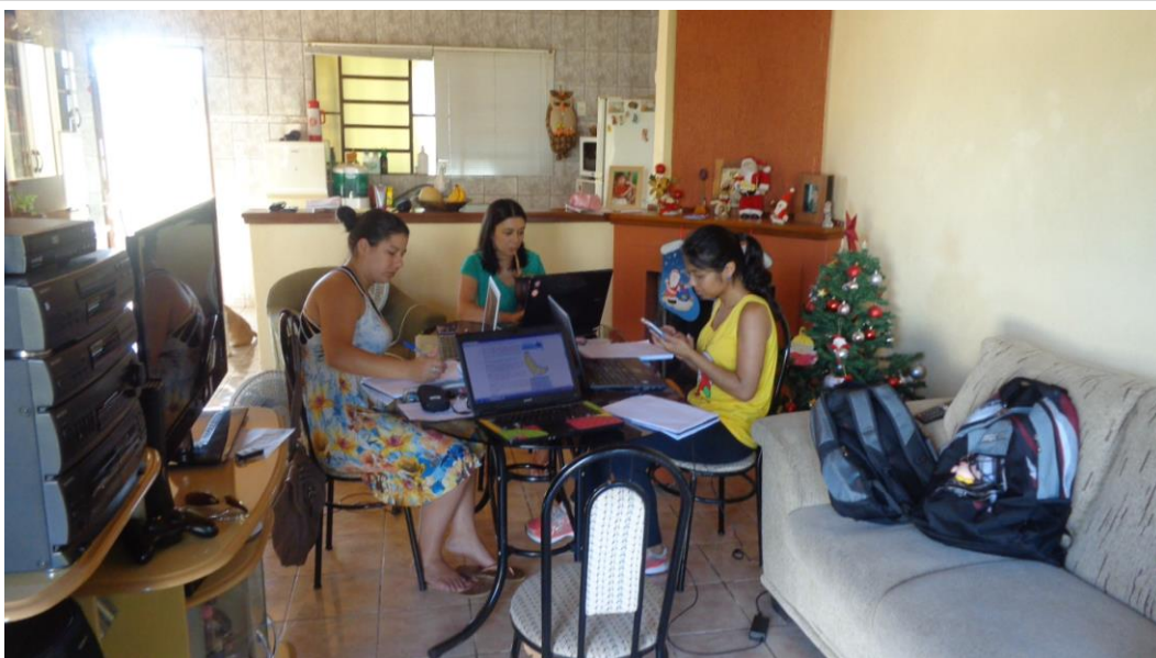
Continuação da montagem da oficina sobre “Composição Química da Célula”.