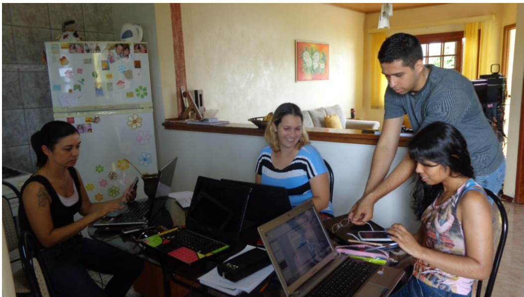
Organização da oficina sobre resumo de artigo.