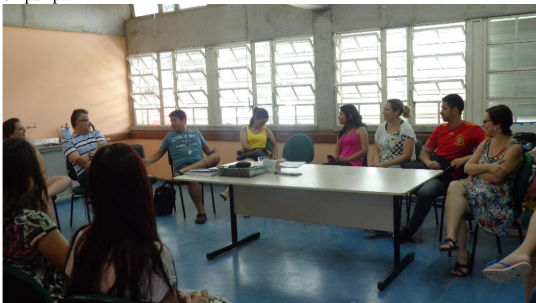
18/12- Reunião geral na escola CIEP.