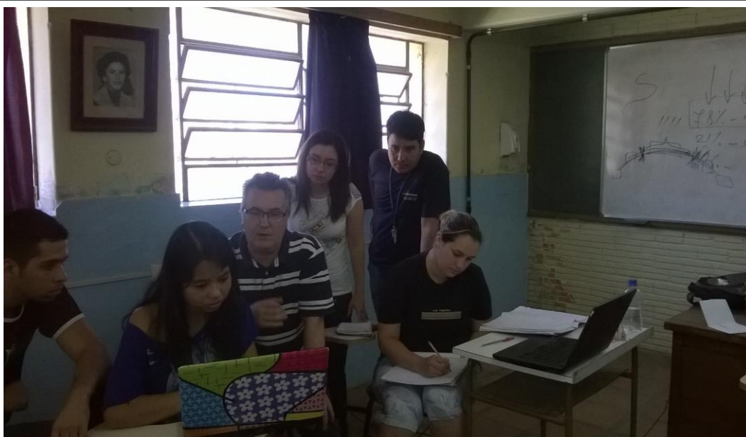
05/12- Conversamos sobre o Seminário temático do Pibid e sobre o cronograma para 2015.