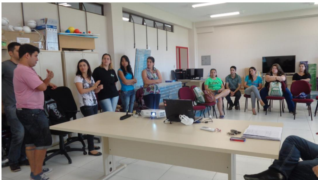
17/12- Apresentação do tema Ética na Docência na roda de conversa dos grupos do Pibid, realizada na Unipampa.