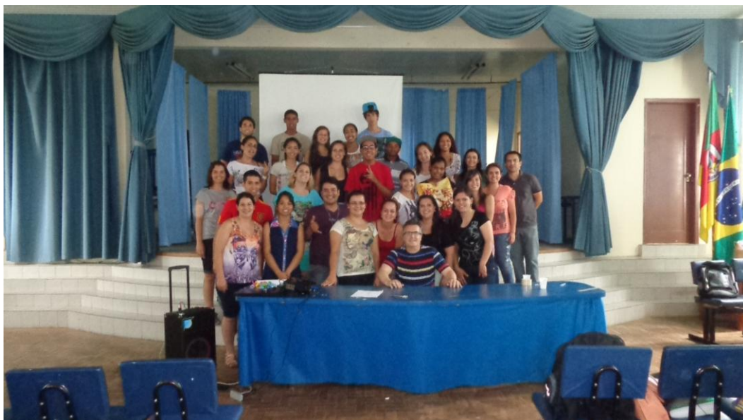
09/12- Trabalhamos na Gincana do ensino médio, com a integração das Escolas Patrocínio e Cândida.