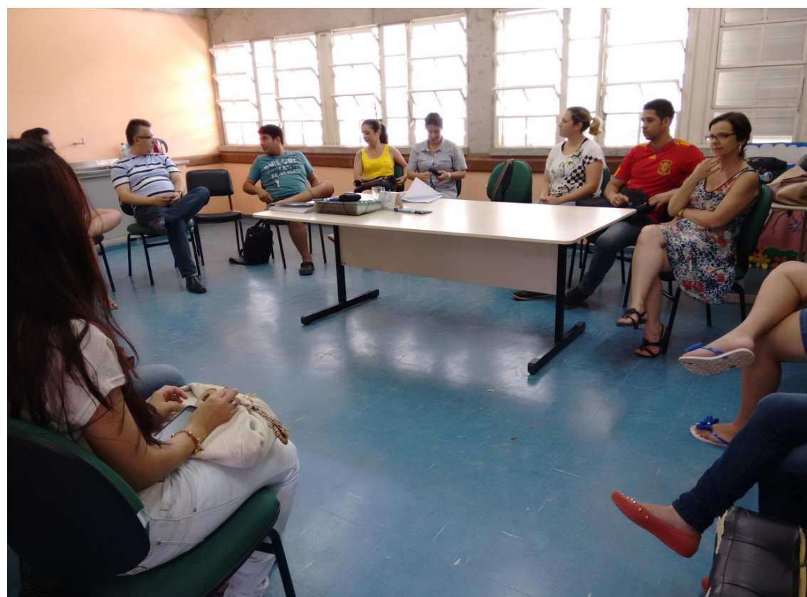
Confraternização dos pibidianos na Escola Ciep.