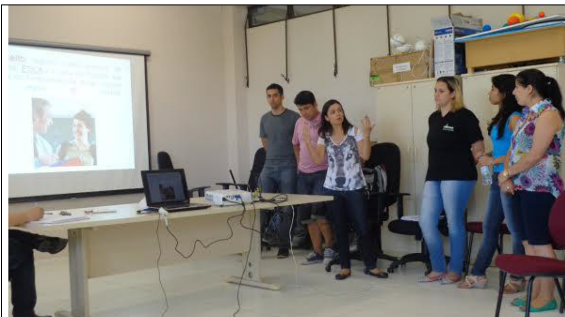
Roda de conversa sobre "Ética na Docência".