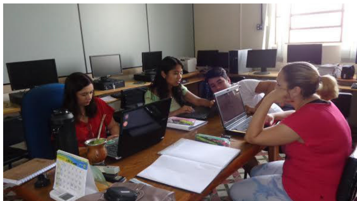
Organização dos slides sobre “Ética na Docência”