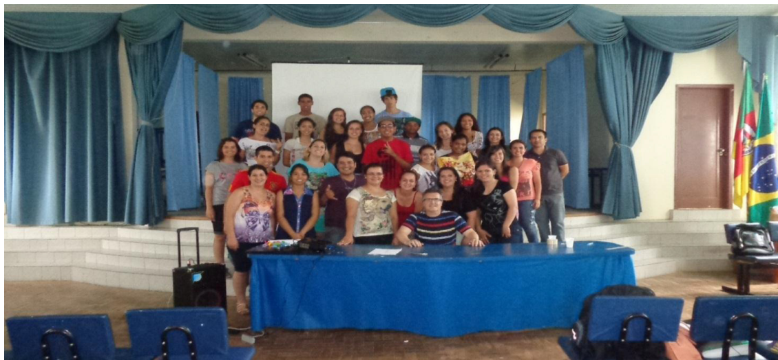
Gincana de encerramento do ano letivo, na Escola Patrocínio – Ensino Médio.