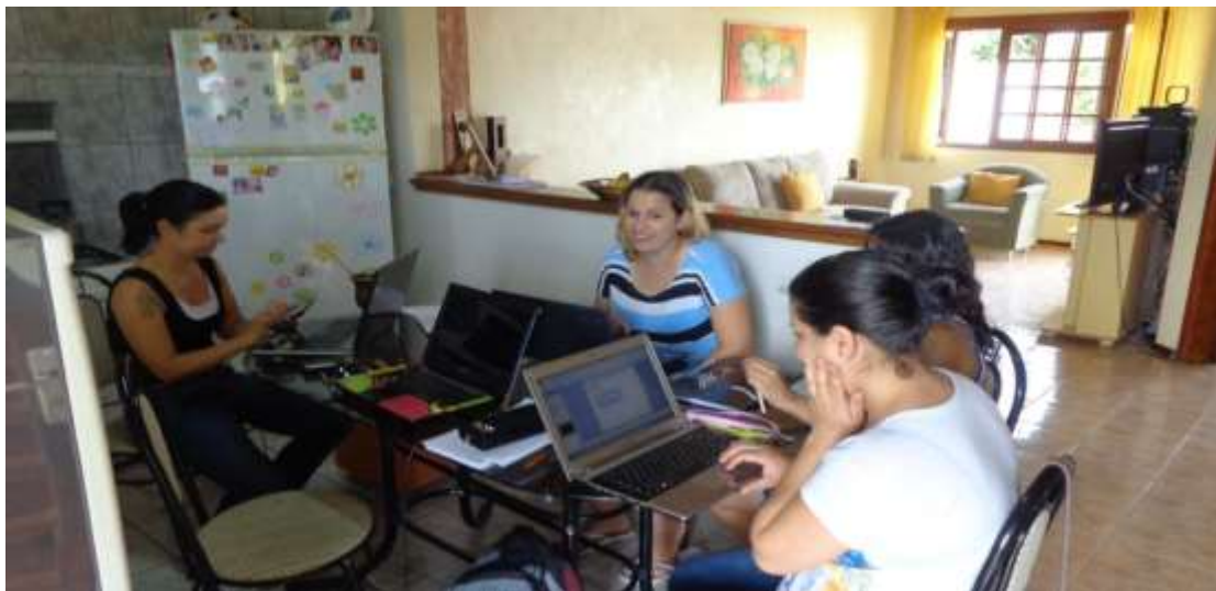
Trabalhamos no planejamento da oficina sobre "Resumos Científicos".