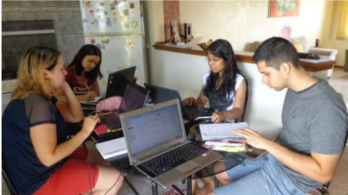
Organização da Oficina sobre "PowerPoint".