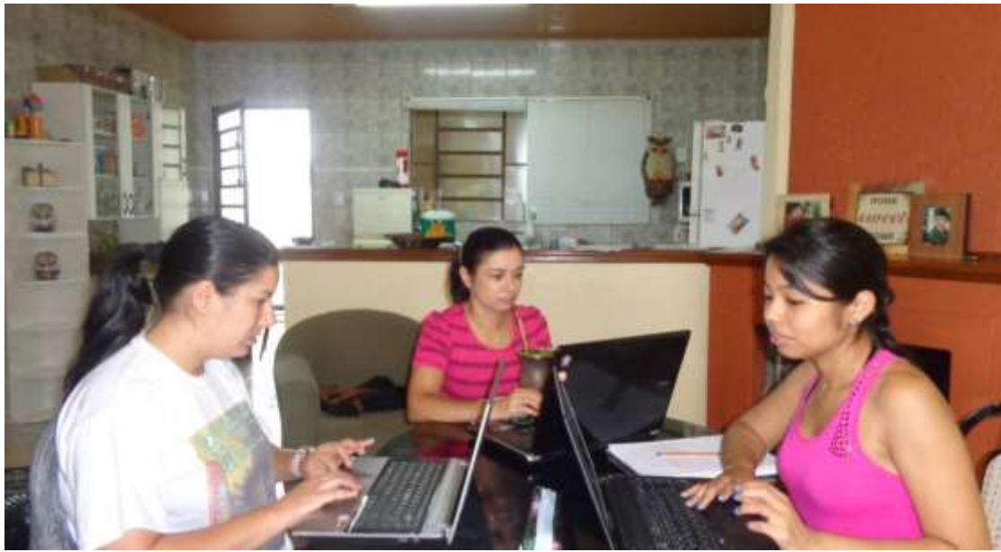
Digitação da oficina e calendário anual.