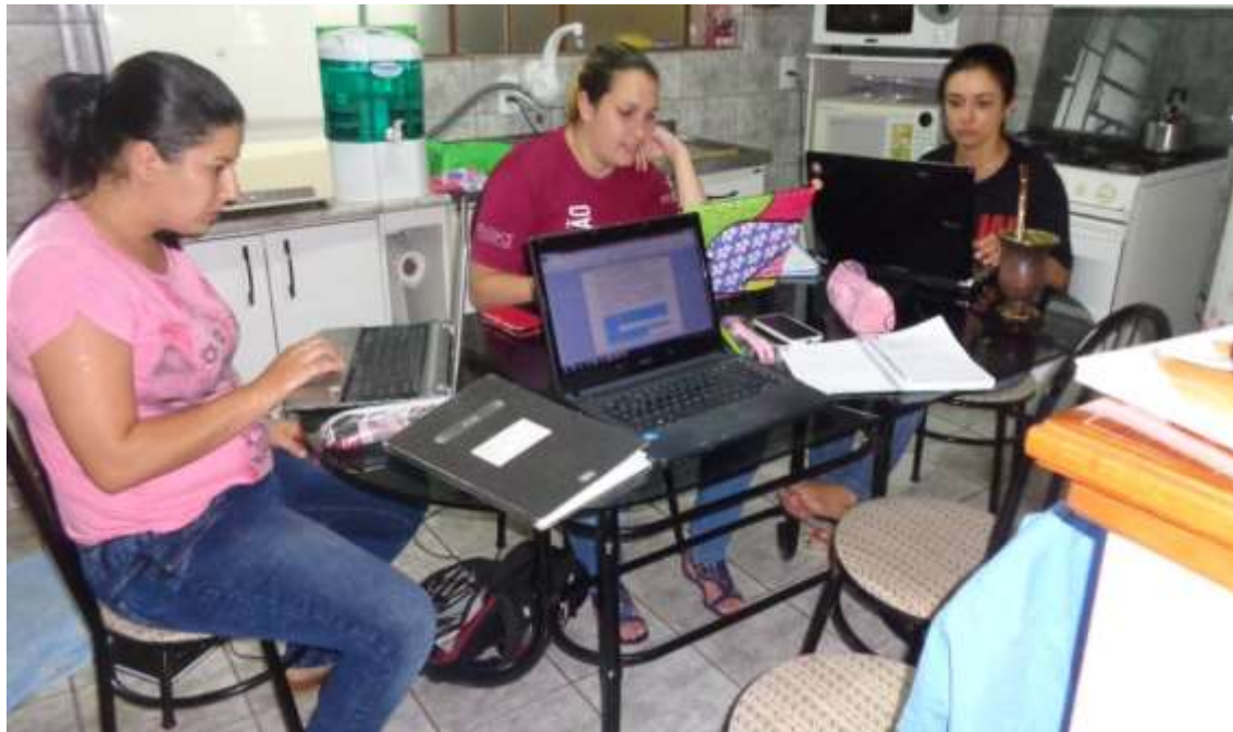
Construção do Portfólio de 2014.