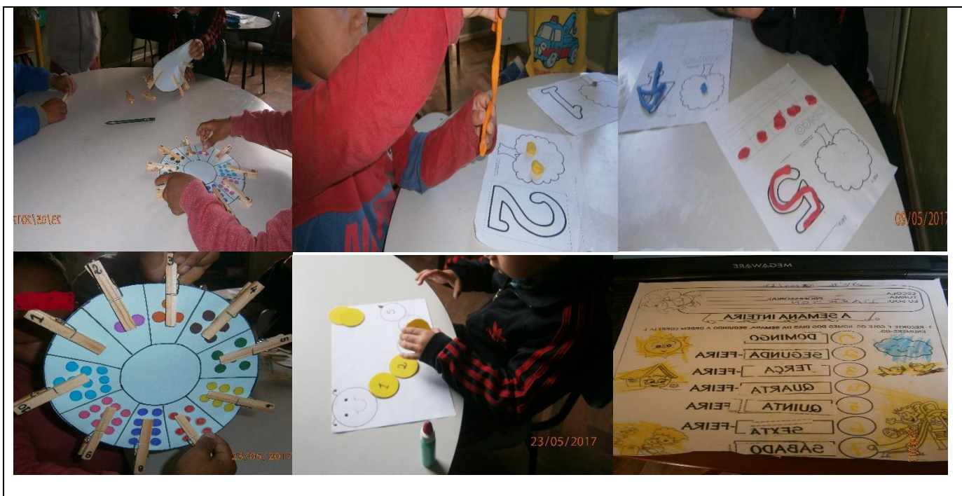
Figura 3: conhecendo os números através de brincadeiras com massinha de modelar; aprendendo a sequência numérica através da colagem da centopeia; recortando e colando os dias da semana.