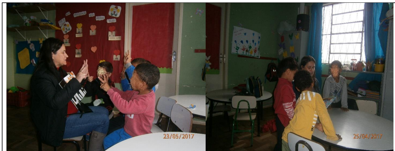
Figura 1: Roda de leitura. Conhecendo os números e as palavras. Material da bolsista.

Durante as rodas de leitura e contações percebemos que os alunos foram familiarizando-se com as palavras e os números e conseguiam refletir sobre os mesmos.