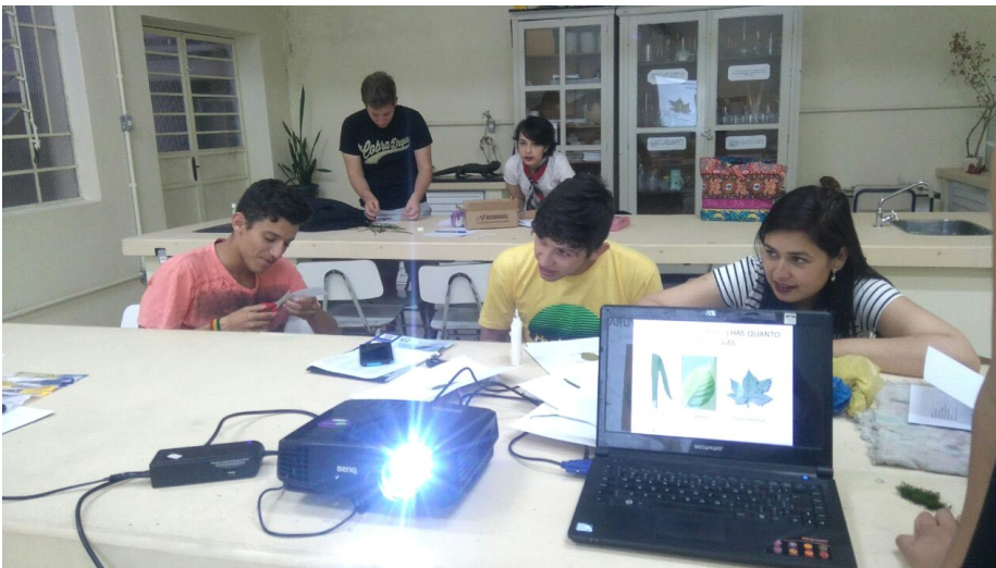
Figura : turma tirando duvidas sobre as características das plantas