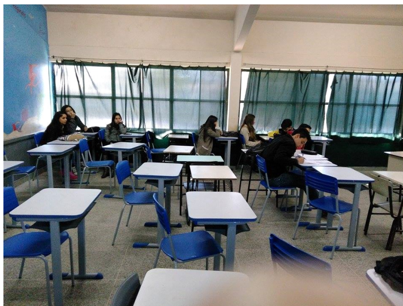
Alunos da turma 303, assistindo a explicação.