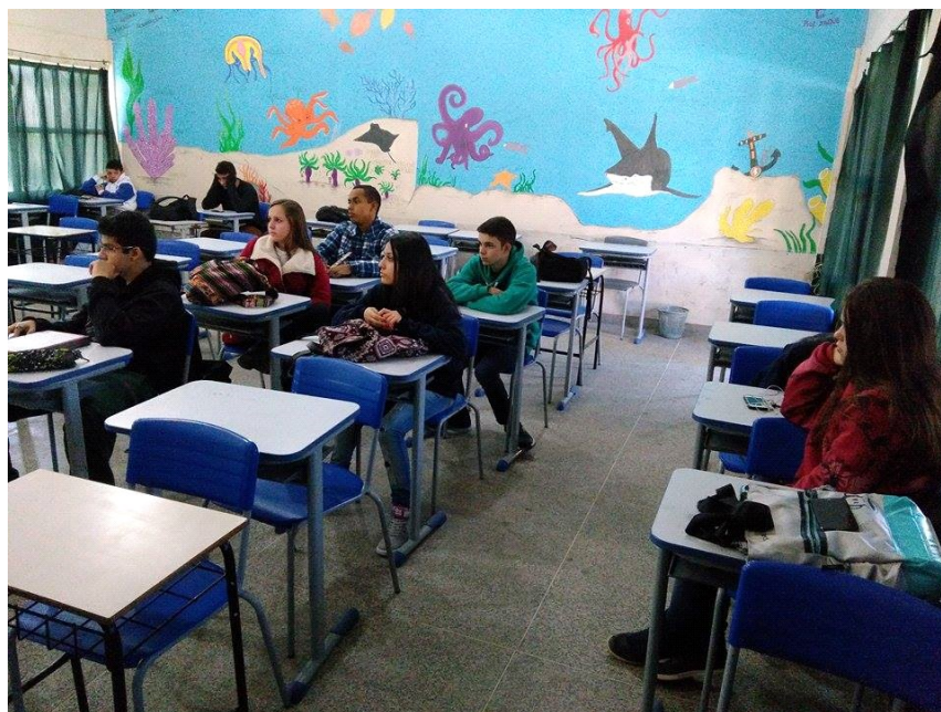
Estudantes da turma 204 assistindo a explicação.