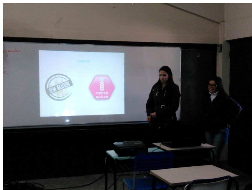
Bolsistas-ID sanando as dúvidas dos alunos.