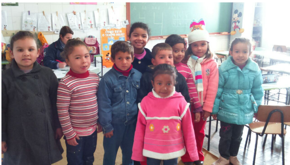
Figura 1: Turma do pré se preparando para ouvir as historinhas.

Todas as turmas para as quais lemos as historinhas foram bastante participativas, e relataram terem gostado muito da atividade.