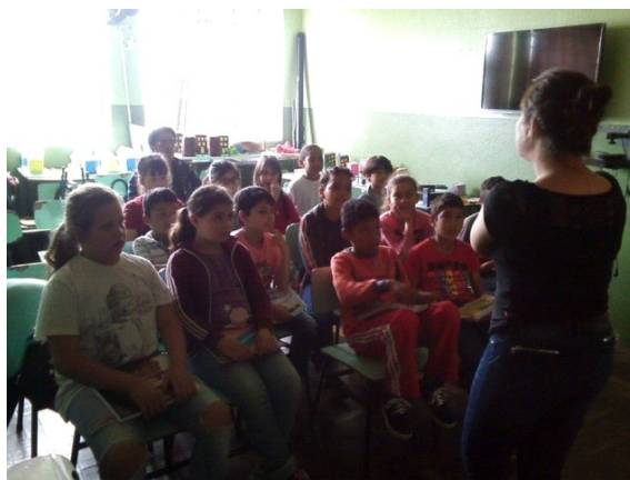
Figura 6- Turma do 3º ano do ensino fundamental.