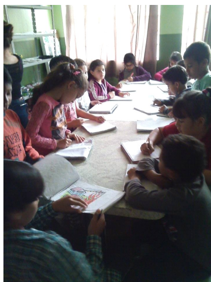
Figura 7- Turma do terceiro ano desenhando a família do coelho.