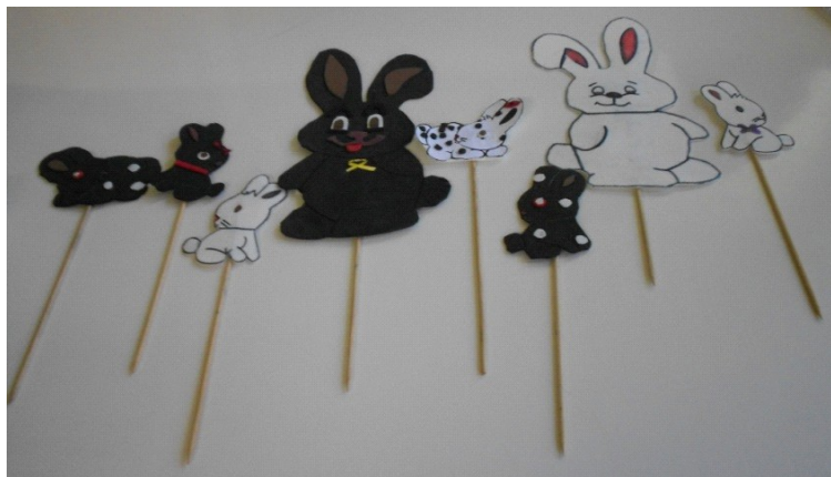
Figura 1- Família do coelho confeccionada pelos alunos.

Para assistir a apresentação (Figuras 4 e 5) foi escolhida a turma 31 do 3º ano do ensino fundamental (Figura 6) do turno da tarde. A atividade ocorreu no dia 20 de outubro, os alunos mostraram gostar da peça. Na seqüência eles tiveram um tempo para desenhar a família do coelho (Figura 7).