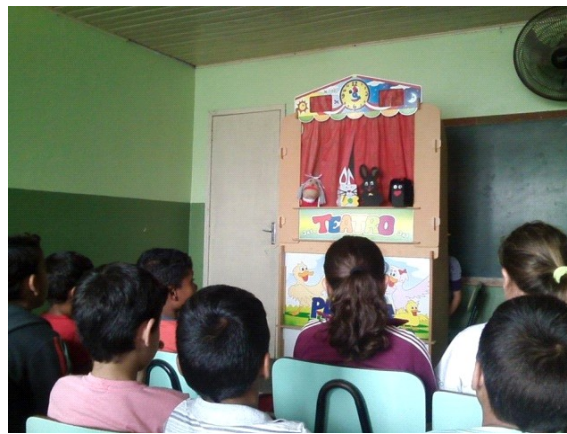
Figura 4- Teatro de fantoche.