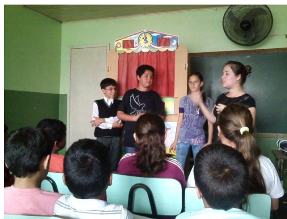
Figura 5- Integrantes do clube de ciências com a bolsista do subprojeto PIBID.