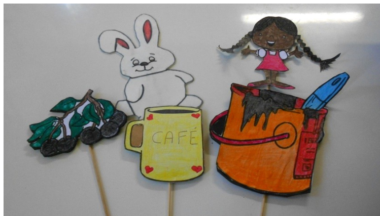
Figura 2- Personagens confeccionados pelos alunos.