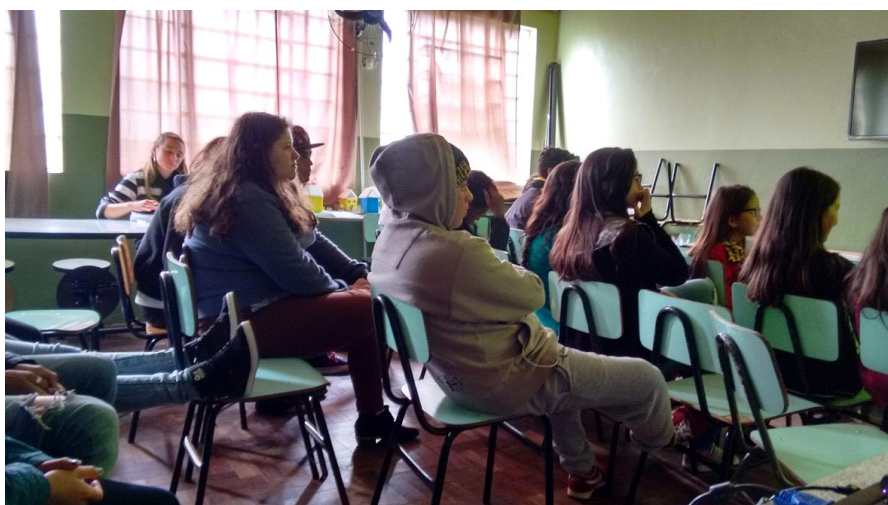
Figura 1: Alunos visualizando a apresentação em slides.

As atividades foram bem significativas, visto que os alunos prestaram bastante atenção e participaram, respondendo perguntas realizadas durante a apresentação, demonstrando interesse e concentração durante as informações, realizando perguntas e mostrando curiosidades e dúvidas.