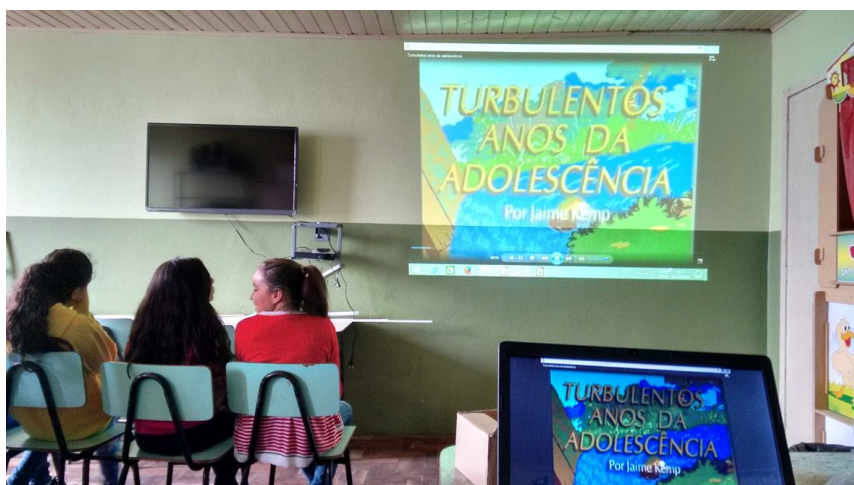
Figura 2: Alunos visualizando o vídeo "turbulentos anos da adolescência".