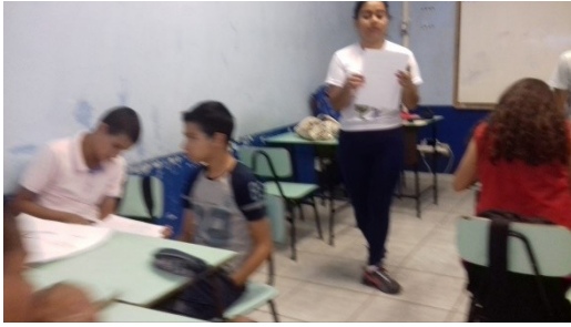
Figura 3. Bolsista desenvolvendo o jogo.