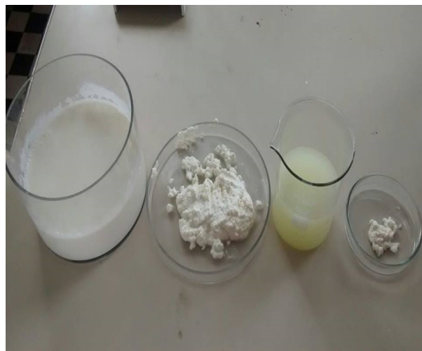
Figura 6: Proteínas obtidas ao final da prática

A segunda atividade proposta nesse dia foi um questionário investigativo, composto por três questões, tendo como objetivo diagnosticar o aprendizado dos alunos da prática com as demais etapas do projeto, ou seja, a química dos alimentos.