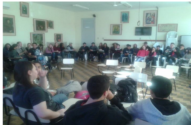
Figura 4: Debate dos alunos referente aos seus grupos sociais

No decorrer do projeto foi ministrada a palestra pela professora da Universidade Federal do Pampa - UNIPAMPA com a finalidade de esclarecer dúvidas que ainda estavam pendentes em relação ao leite e suas adulterações além de contribuir com a construção dos argumentos de cada setor social representado. Foi observado que a adulteração do leite ocorre há muito tempo, porém antes não era evidenciado pela mídia.