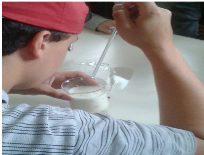
Figura 5: Aluno observando a separação das proteínas

do leite industrial rotulado, cujo o leite natural apresentou dados melhores que o rotulo do industrial que por sua vez não satisfazia a descrição apresentada na embalagem. Além disso, a prática teve a intenção de manusear, separar e comprovar a existência das proteínas no leite (Figura 5).