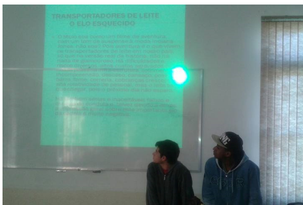
Figura 3: Alunos realizando a defesa dos grupos sociais

Como relatado na metodologia, a próxima etapa do projeto foi a divisão das turmas em grupos, os representantes sociais. Observou-se o envolvimento dos alunos com o setor que representavam pelo empenho em apresentar argumentos para defesa de seu grupo em forma de seminário conforme ilustra a Figura 3. Após a apresentação e defesa dos argumentos de cada grupo, ocorreu um debate (Figura 4), onde os alunos expuseram suas conclusões a respeito da pesquisa realizada defendendo seu grupo social independente de sua opinião pessoal.