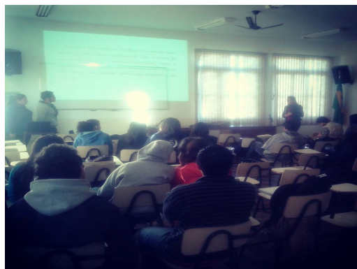
Figura 2: Publico da palestra

Como relatado na metodologia, a próxima etapa do projeto foi a divisão das turmas em grupos, os representantes sociais. Observou-se o envolvimento dos alunos com o setor que representavam pelo empenho em apresentar argumentos para defesa de seu grupo em forma de seminário conforme ilustra a Figura 3. Após a apresentação e defesa dos argumentos de cada grupo, ocorreu um debate (Figura 4), onde os alunos expuseram suas conclusões a respeito da pesquisa realizada defendendo seu grupo social independente de sua opinião pessoal.