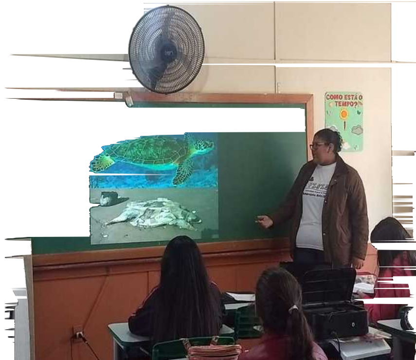
Fig. 1: Apresentação do assunto aos alunos do 7º ano da E.M.E.F João Manuel Salvadé.