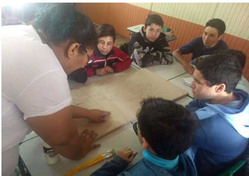
Fig. 3: Explicação de como realizar a atividade.