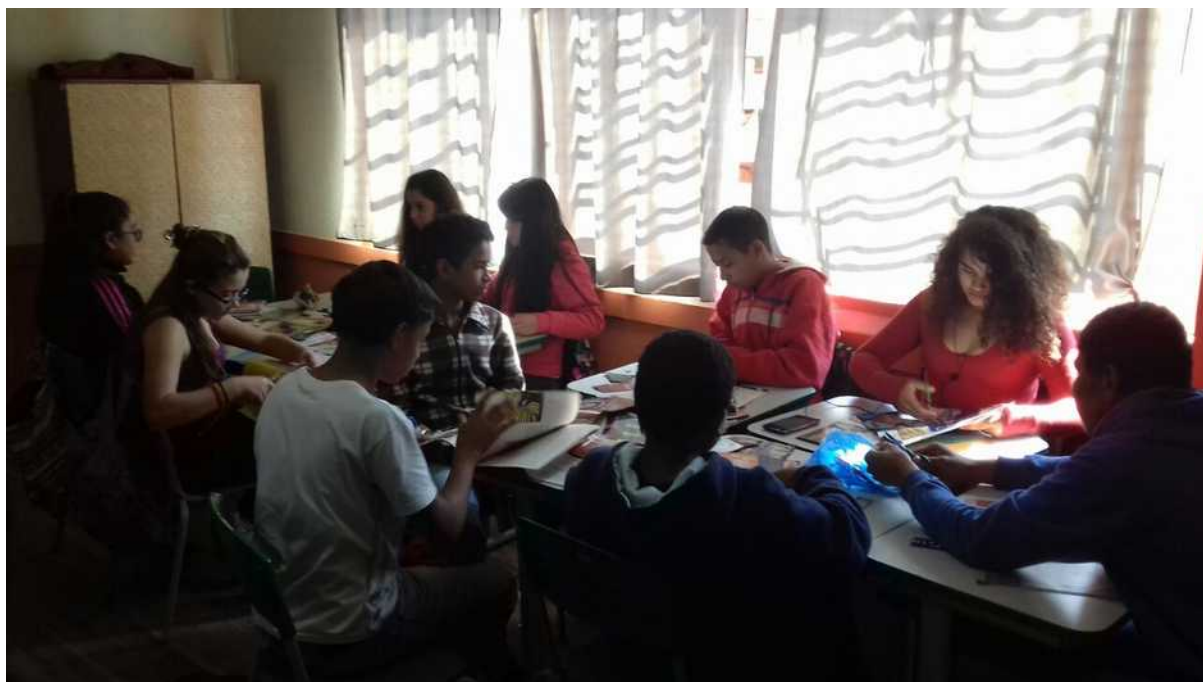
Fig.5: GRUPO A, recortando os papéis.