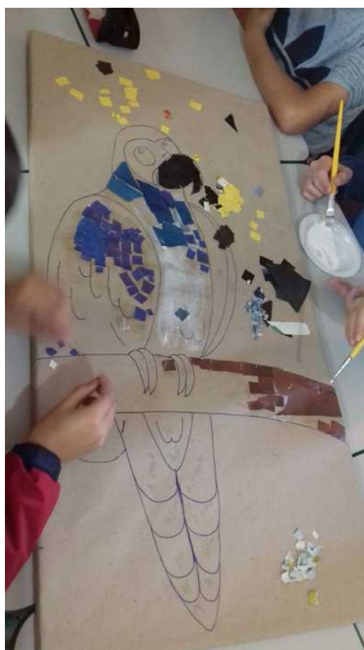
Fig. 4: Quadro sendo montado pelos alunos do GRUPO B.