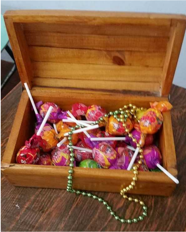
Figura 4: Premiação para o grupo vencedor do caça ao tesouro.