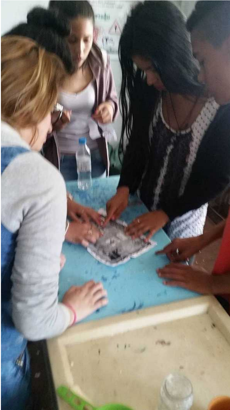
Figura 3: Alunos solucionando a última pista do caça ao tesouro.