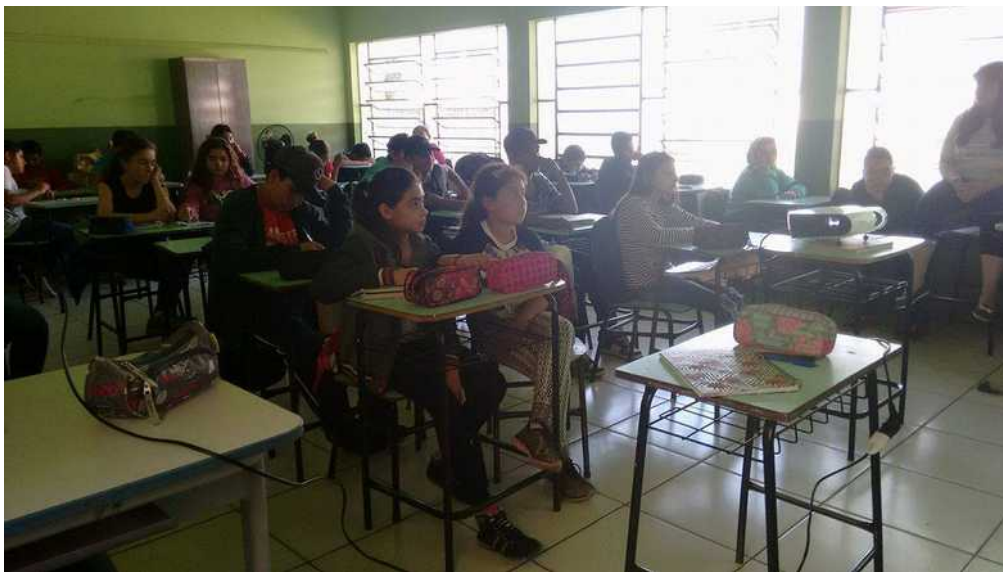
Figura 2: Alunos prestando atenção na intervenção.