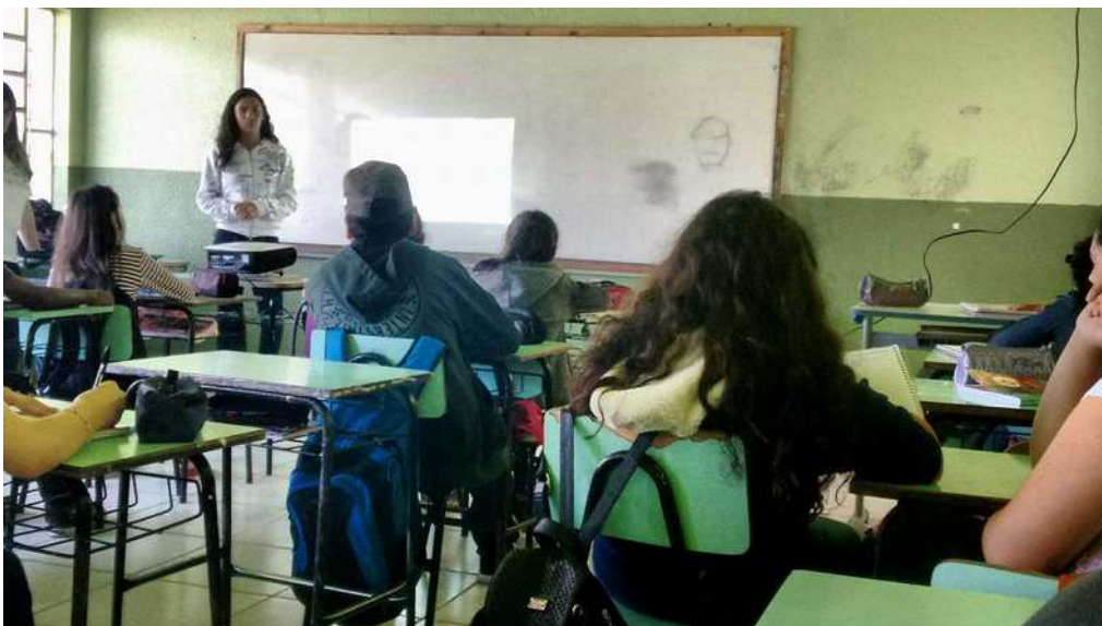
Figura 3: Bolsista-ID tirando as dúvidas dos alunos.