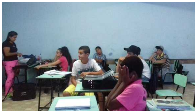
Imagem 3. Grupo de alunos participando do jogo.