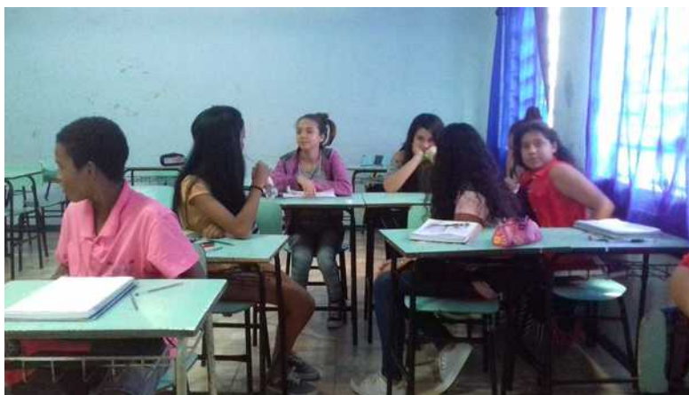
Imagem 4. Grupo de alunos trabalhando em equipe para responderem as questões do jogo.