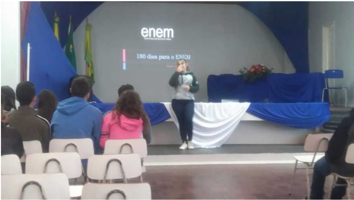
Figura 1: Apresentação da proposta