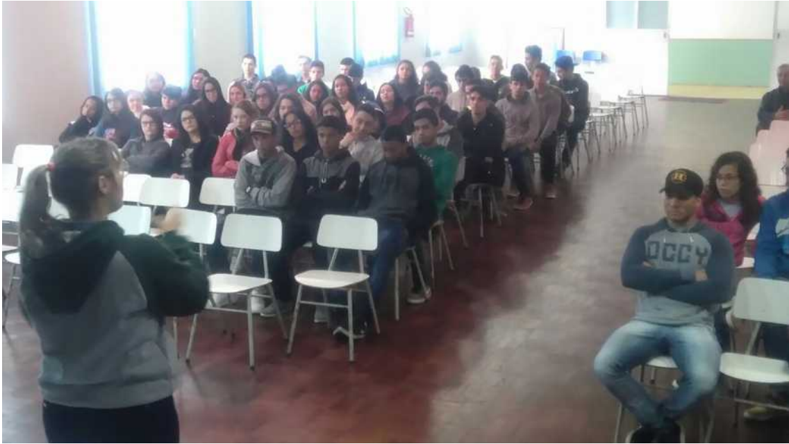
Figura 3: Alunos e bolsista durante a palestra