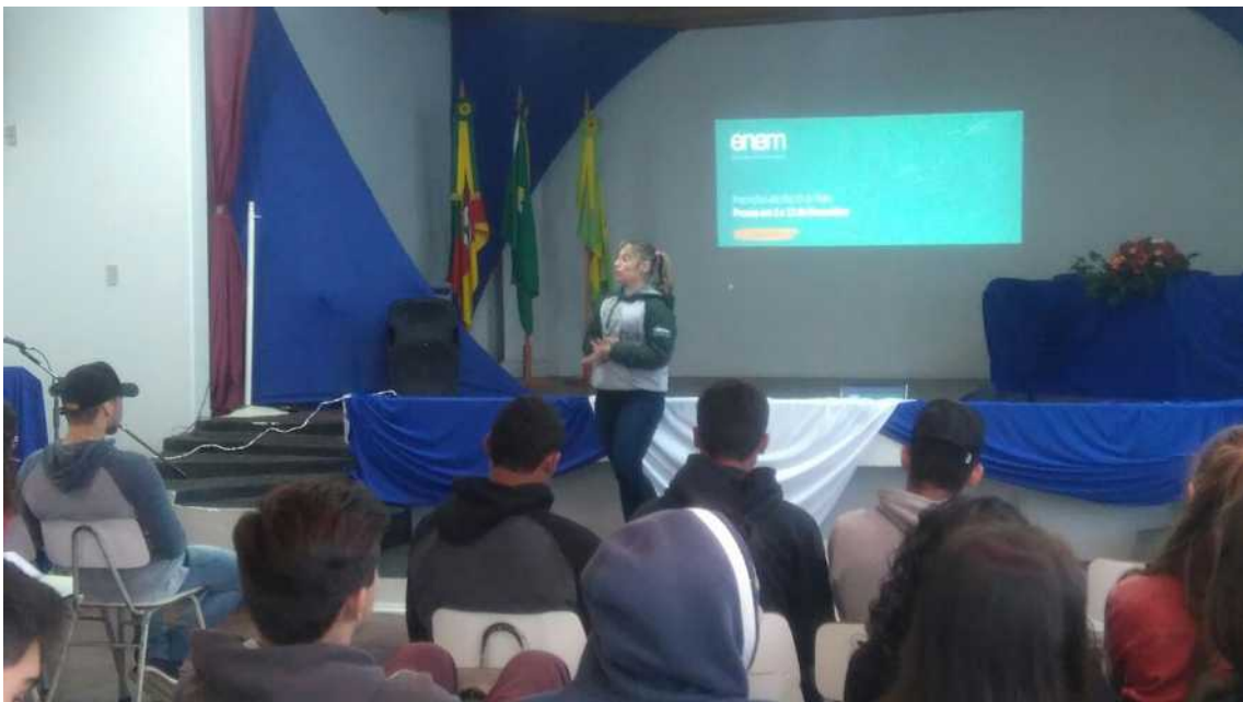
Figura 2: Bolsista explanando sobre o ENEM