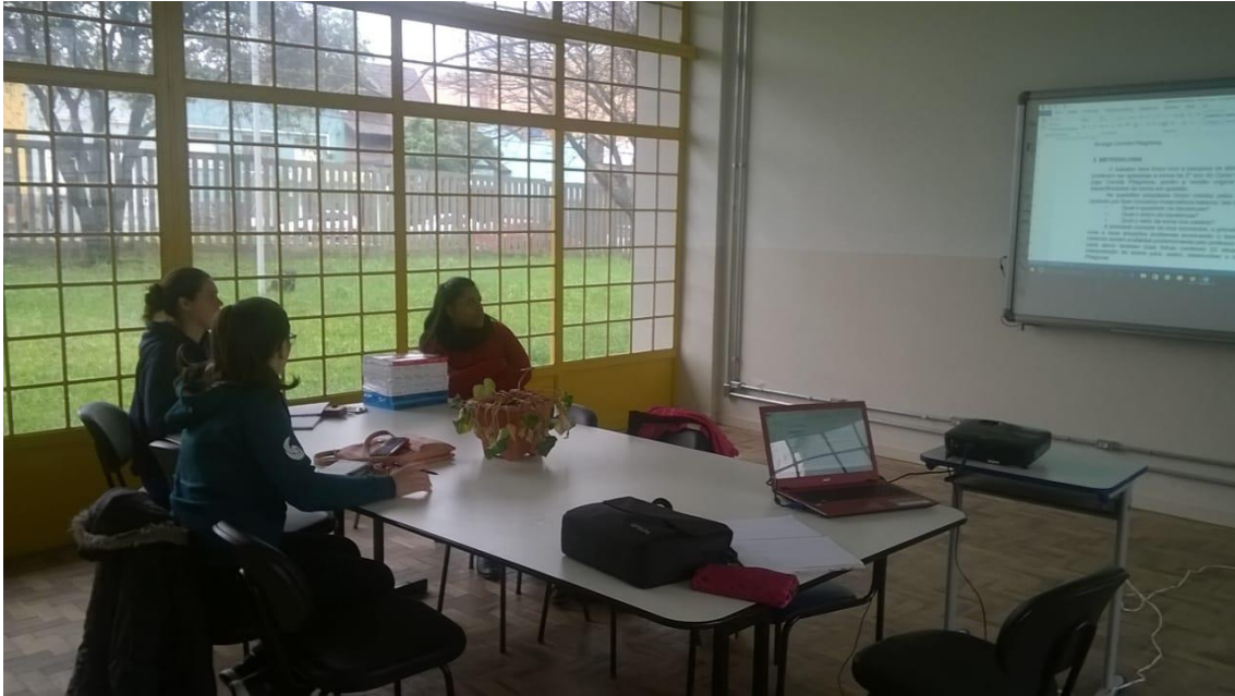
Reunião de planejamento 13/09/2017.

14/09 – Reunião de planejamento. Escrita para o Siepe.