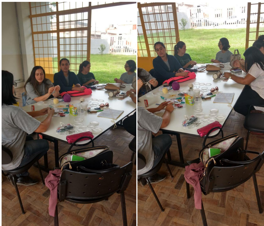
Reunião de planejamento 06/10/2017

escolhida foi a construção do filtro dos sonhos, a previsão é de que essa atividade aconteça na última semana desse mês.