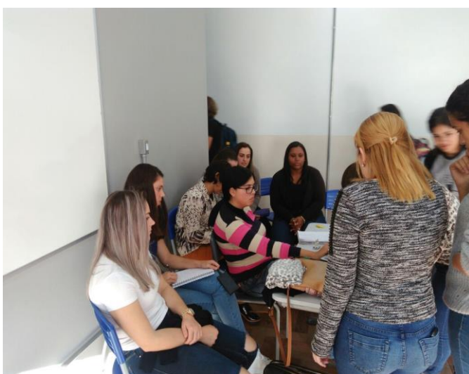
Orientação do projeto videoaulas 23/06/17.