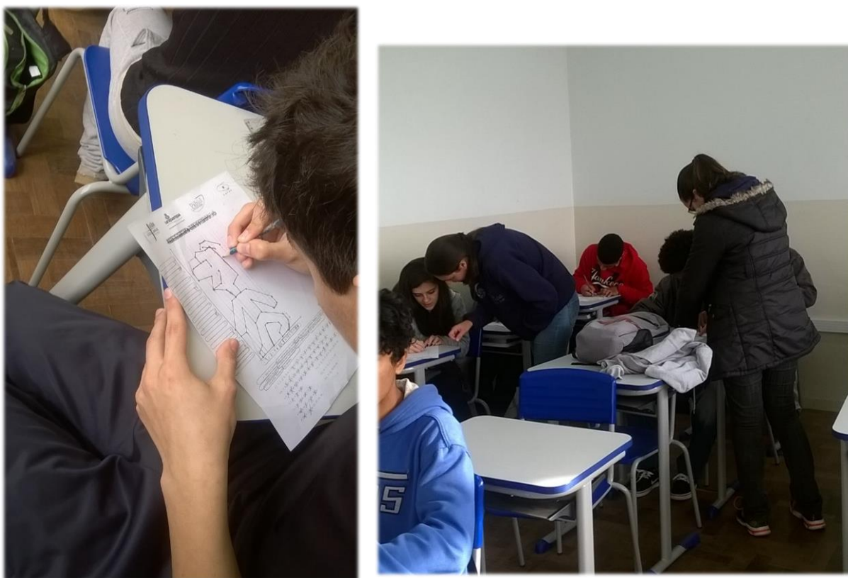
Atividade desenho misterioso.

31/05- Atividade Desenho Misterioso. A atividade aconteceu nas turmas 13, 14, 15, eu participei da atividade nas turmas 14 e 15. Apesar da professora ter alertado sobre as dificuldades dos alunos e agitação a atividade nas duas turmas aconteceu de forma muito tranquila, os alunos foram receptivos e se interessaram pela atividade se mostrando curiosos sobre qual seria o seu desenho misterioso. Em ambas as turmas as dificuldades foram as mesmas, como por exemplo, a dificuldade em identificar o x e y no par ordenado e localizar pontos com zero em x ou y. Acredito que a atividade tenha sido de grande valia pois os alunos tiveram a oportunidade de trabalhar as dificuldades de uma forma divertida.