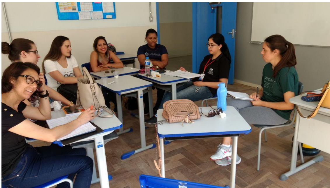
Reunião de planejamento 25/08/2017

25/08 – Reunião de planejamento. Nessa reunião começamos a planejar atividades para aplicar nos 6º e 7º anos, que não são turmas da professora supervisora. A realização de atividades com essas turmas foi um pedido da coordenação da escola, pois elas estão com baixo rendimento em matemática e a coordenação acredita que o PIBID pode ajudar os alunos sanando as dúvidas e os motivando com atividades diferenciadas.