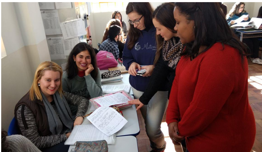
Orientação do projeto videoaulas 12/06/17.

foi muito direto, pois como se trata de um vídeo para crianças é preciso que toda a explicação seja feita com calma, passo a passo e com clareza, para esse grupo foi sugerido que mudem a abordagem para que o vídeo fique mais didático e de melhor compreensão para crianças. Mesmo com o atraso de alguns, todos já estavam ao menos com as ideias e materiais a serem utilizados prontos. Para a próxima orientação que ficou marcada para o dia 23, foi solicitado que todos os grupos estejam com seus vídeos finalizados.