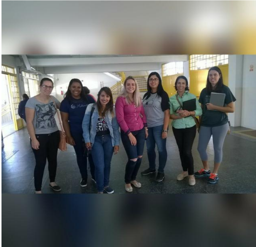
1º Reunião grupo PIBID Justino Quintana Março/2017