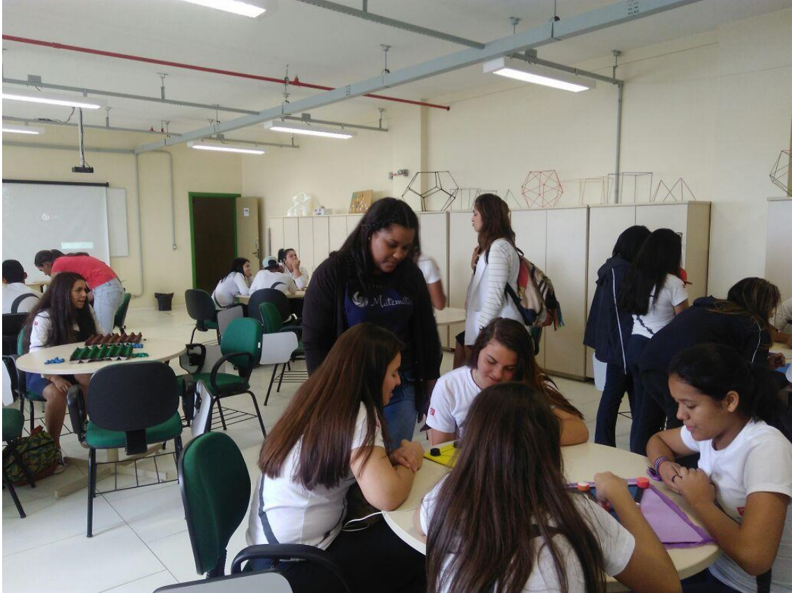
Oficina Jogos africanos 24/10/2017