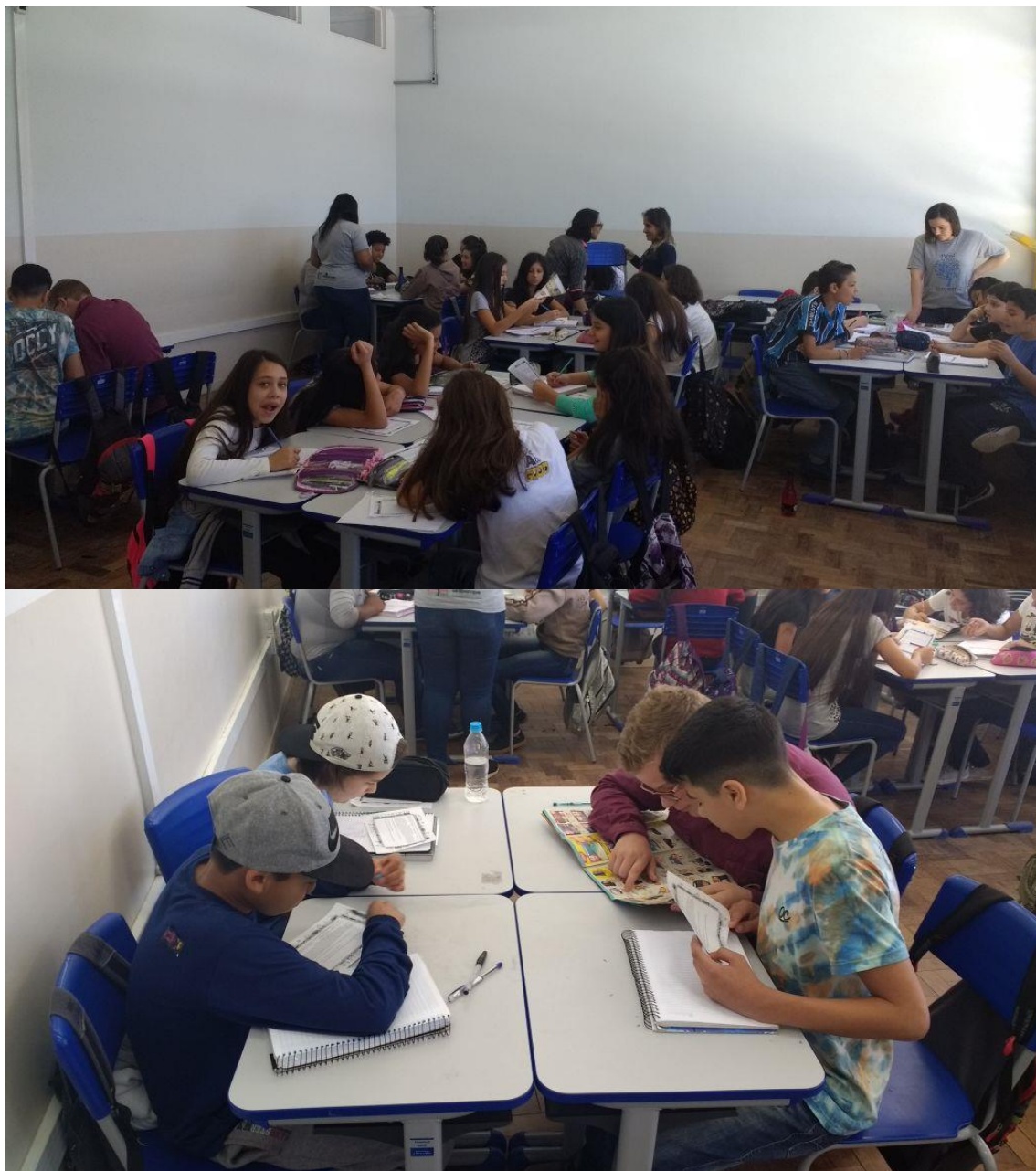
Atividade 6° ano 20/10/2017

mais de um problema. Fiquei muito feliz com essa atividade, pois os alunos mostraram muito empenho e dedicação no decorrer da atividade.