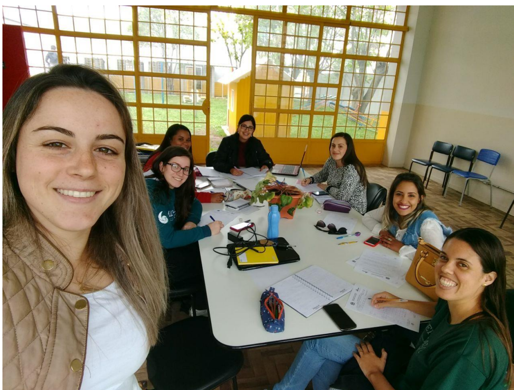
Reunião de planejamento 06/09/2017

06/09 – Reunião de planejamento - Nessa reunião começamos a produção de umas das atividades que serão trabalhadas nas turmas de 6º e 7º anos. Criamos problemas baseados em encartes de lojas da cidade, envolvendo as operações básicas que os alunos tem mais dificuldade, a ideia é dividir as turmas em grupos e cada grupo terá um encarte e deverá resolver os problemas baseados nele. O objetivo é de que os alunos trabalhem as operações básicas relacionando com situações praticas do dia a dia como compras em lojas e mercados. Ainda nessa reunião preenchemos a folha ponto referente ao mês de agosto.