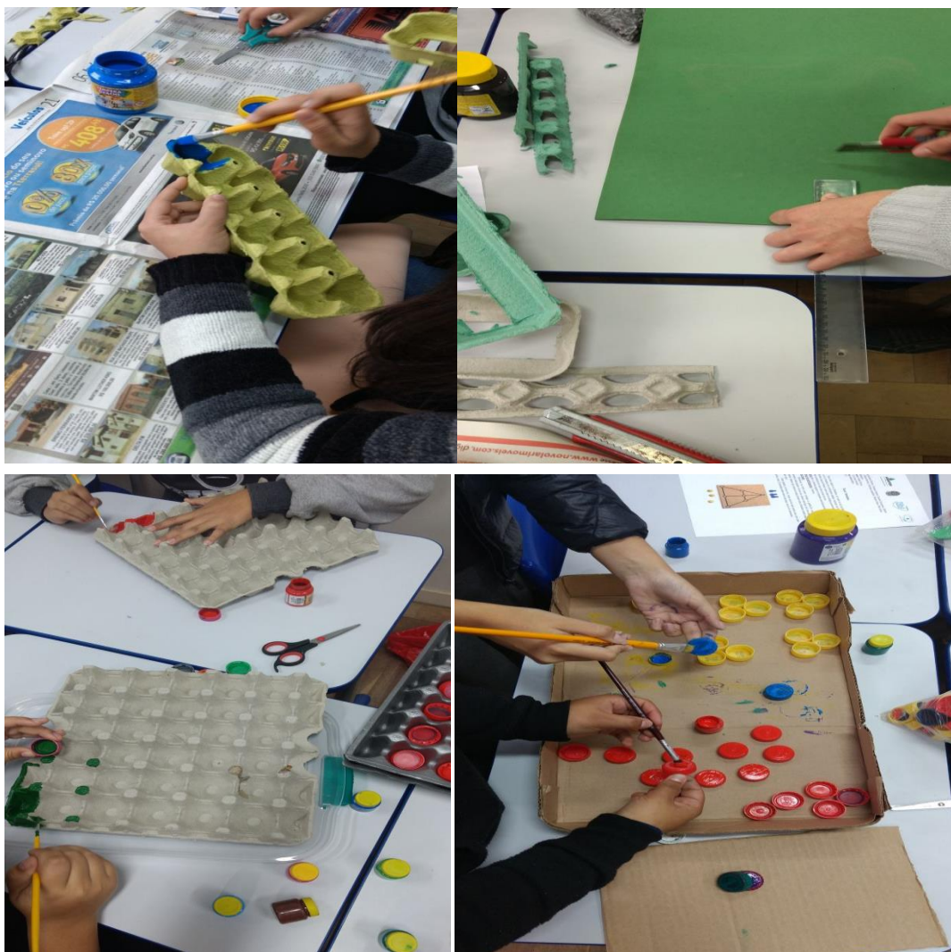
Alunos construindo os jogos.

10/08 - Atividade do projeto territorialidade negra. Após terem feito a produção dos jogos os alunos aprenderam a forma de jogar cada jogo proposto para as turmas. Os jogos de maneira geral são bem simples e devem ser jogados em duplas, sendo apenas preciso utilizar o raciocínio lógico. Os alunos tiveram bastante facilidade para entender as regras e a forma de jogar, alguns montaram estratégias e descobriram alguns macetes para vencer o adversário, o mais complicado é o Mancala, pois exige um pouco mais de atenção. A próxima etapa é os alunos levarem os jogos construídos por eles para aplicar com as turmas do ensino fundamental.