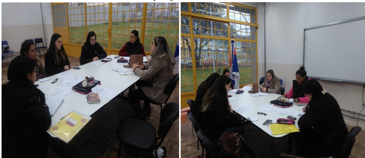
Reunião de planejamento 11/08/2017

17/08 – Atividade matix. Essa atividade foi aplicada na turma do 2º ano do curso normal para trabalhar matrizes. No início os alunos não tinham entendido que era preciso ter uma estratégia para retirar os números negativos e positivos pois no final iriam somar para descobrir o vencedor, já na parte de identificar a localização correta de cada elemento todos tiveram muita facilidade, ainda não tínhamos trabalhado com o segundo ano, percebi que é uma turma boa para trabalhar com esse tipo de atividade bastante calma e disposta.