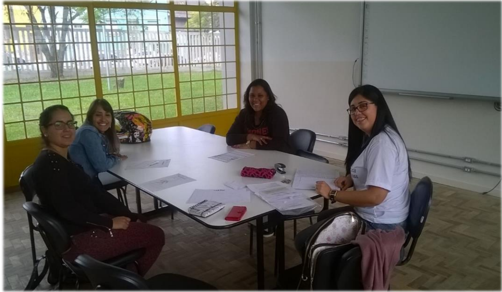
Reunião de planejamento 03/05/17.

05/05 – Reunião de Planejamento. Organização do material do jogo de dominó para aplicação nas turmas 11 e 12 do magistério. Também foi conversado sobre o projeto de videoaulas do 3º ano, os alunos terão a primeira orientação no dia 08/05. A professora teve a ideia de que os alunos da turma que tem mais familiaridade com programas de edição de vídeo realizem uma oficina para ensinar os colegas. A ideia foi bem recebida pelas bolsistas.