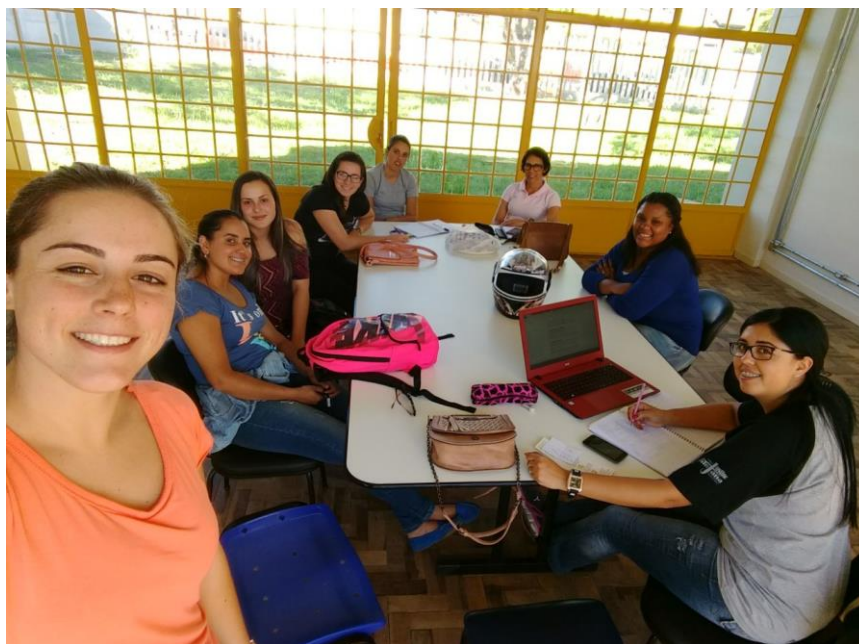
Reunião de planejamento 07/04/17.