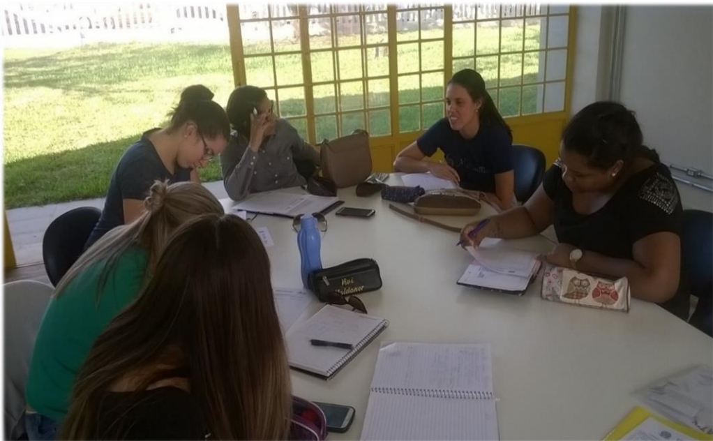
Reunião de planejamento 05/05/17.

05/05 – Reunião de Planejamento. Organização do material do jogo de dominó para aplicação nas turmas 11 e 12 do magistério. Também foi conversado sobre o projeto de videoaulas do 3º ano, os alunos terão a primeira orientação no dia 08/05. A professora teve a ideia de que os alunos da turma que tem mais familiaridade com programas de edição de vídeo realizem uma oficina para ensinar os colegas. A ideia foi bem recebida pelas bolsistas.