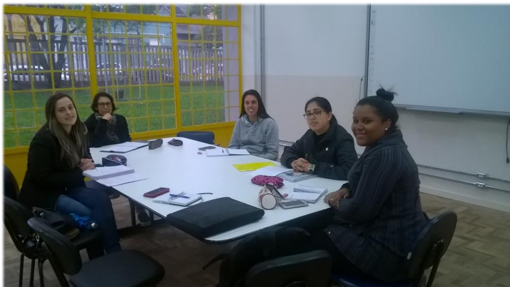
Reunião de planejamento 26/05/17.

26/05 – Reunião de Planejamento. Nessa reunião organizamos a atividade para os 1º anos do ensino médio diurno a atividade do desenho misterioso tem como objetivo trabalhar o plano cartesiano.