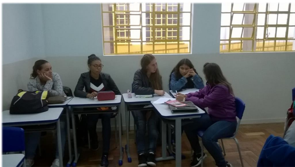
1º Orientação do projeto de videoaulas.

08/05 – Projeto videoaulas. Primeira orientação da atividade. As bolsistas verificaram com cada grupo como anda a preparação das videoaulas nessa primeira orientação foi solicitado pela professora que eles tivessem pesquisado sobre o conteúdo e feito um esboço do roteiro do vídeo. Todos os grupos fizeram o solicitado e alguns já estão com suas ideias bem solidas e prontos para iniciar a gravação. Fiquei surpresa com a dedicação e interesse da turma, que apesar de ser agitada é bem madura e realiza as atividades com muita qualidade.