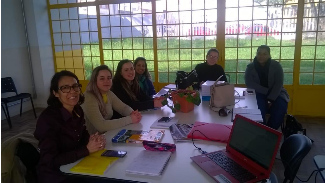
Reunião de planejamento 15/09/2017.

21 - 22/09 - Fórum das Licenciaturas / Seminário Institucional Pibid-Unipampa.