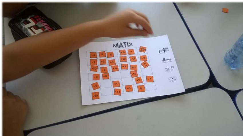
Atividade Matix 7° ano.

tiveram mais dificuldade. No decorrer do jogo alguns foram perdendo o interesse, mas de forma geral a atividade foi muito boa.