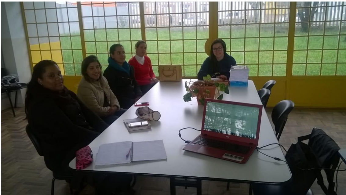
Reunião de planejamento 14/09/2017.

14/09 – Reunião de planejamento. Escrita para o Siepe.