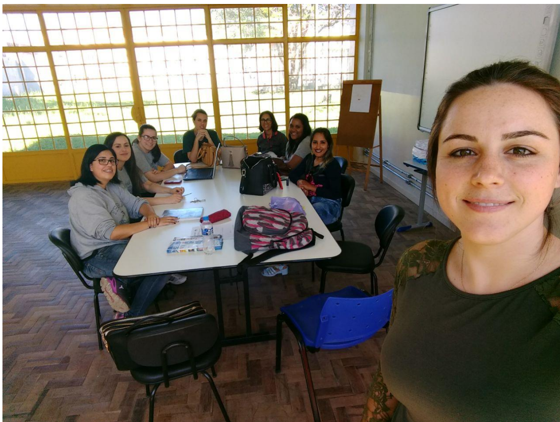
Reunião de planejamento 20/10/2017.

24/10 – Oficina jogos Africanos. A convite da coordenação fomos realizar uma oficina sobre os jogos africanos na Unipampa para os alunos da escola Fundação Bradesco que foram fazer uma visita ao campus. Durante a oficina falamos brevemente sobre o aspecto histórico dos jogos e a motivação para a construção da atividade, após, explicamos a dinâmica de cada jogo e os alunos jogaram em duplas. Apesar do tempo curto foi muito interessante apresentar uma atividade construída na escola que atuamos para alunos de outra instituição. Também ficamos muito felizes em representar o curso de matemática durante esse momento.