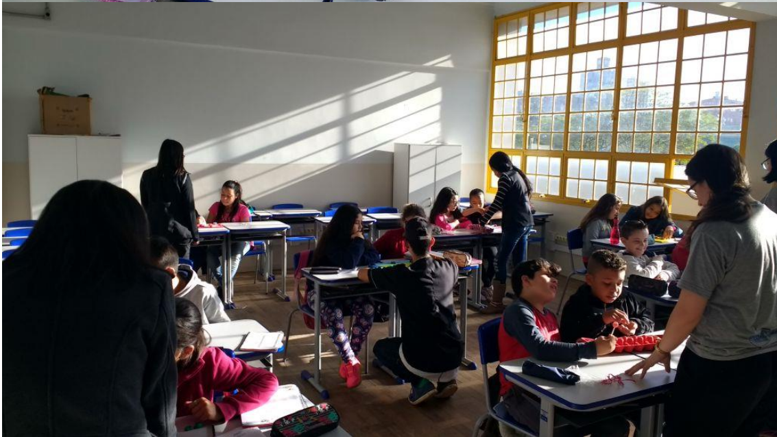
Atividade jogos africanos 4° e 5° anos 20/10/2017.

20/10 – Atividade problemas com encartes de lojas. A atividade tinha como objetivo trabalhar as dificuldades e sanar as dúvidas dos alunos do 6° ano com relação as operações básicas, a realização dessa atividade foi um pedido da coordenação da escola devido ao baixo rendimento desses alunos na disciplina de matemática. A atividade consistia em problemas envolvendo situações cotidianas baseadas em encartes de lojas, como farmácias, mercados, e lojas de eletrodomésticos. A atividade ocorreu tranquilamente, a turma demonstrou interesse na atividade, alguns grupos resolveram