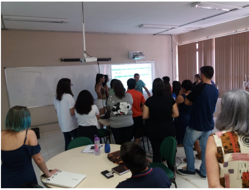
Figura - Conhecendo e interagindo com a lousa digital.