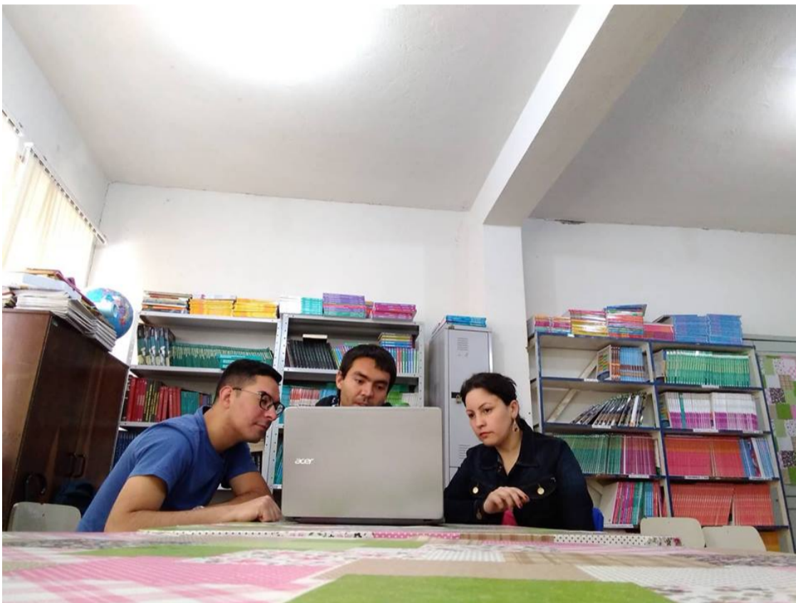
Figura - Na biblioteca da escola, trabalhando no relatório das bases de dados educacionais.

Reflexão: Relatório trabalhoso, e assim como muitas outras atividades de escrita, nunca está concluído, cada revisão identifica-se algo a melhorar e complementar... melhor parar por aqui, porque tende ao infinito...kkk