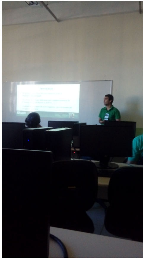
Figuras - Apresentação de trabalhos no SIEPE.