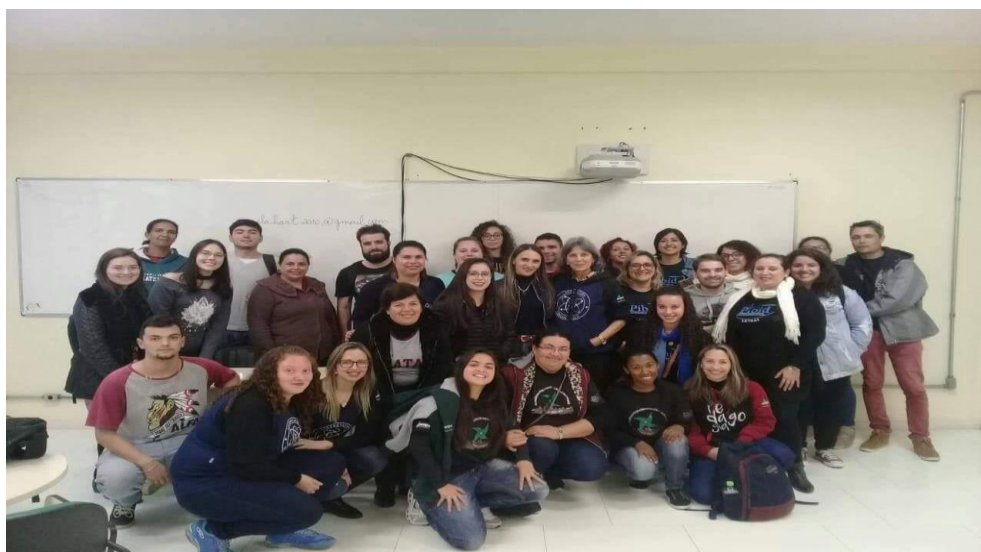
Anexo 5, apresentação no Siepe: