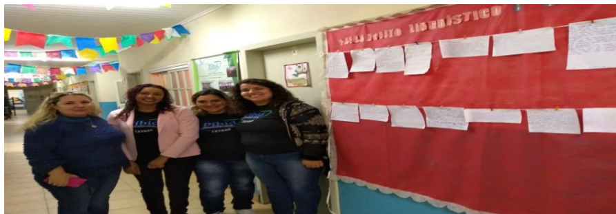
Anexo 4, Intra-Pibid em Bagé.