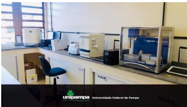
Figura 9: Laboratório de testagens – estrutura, informações e resultados

Num ano atípico, assolado pela pandemia do novo coronavírus, o Campus São Gabriel conquistou um lugar de destaque regional pela iniciativa de alguns de seus docentes de criar um laboratório de testagens moleculares para a detecção de Sars-CoV-2 na população dos municípios da região onde está inserido, chegando a atender 16 municípios e realizando mais de 20 mil testes. Aliando expertises, infraestrutura, recursos internos e externos (figura 9), parcerias e trabalho, essa iniciativa colocou o Campus e a Instituição como um todo noutra patamar de reconhecimento regional, pela agilidade, eficiência, rapidez, qualidade e relevância dos serviços prestados, estreitando ainda mais a parceria entre a Universidade e a Prefeitura Municipal de São Gabriel, bem como a de outros municípios da região.