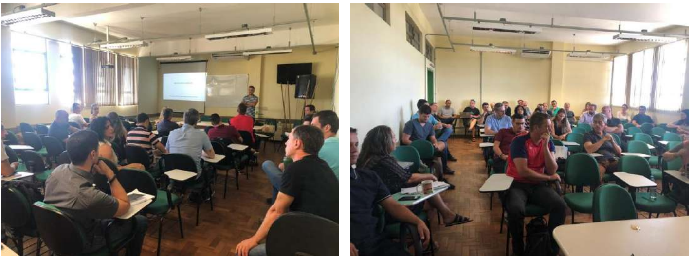
Figura 2: Semana Pedagógica no Campus São Gabriel

Fonte: Interface ACS do Campus São Gabriel