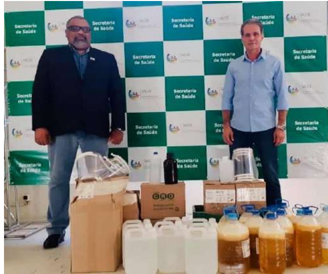
Figura 3: Entrega de insumos para o município de Bagé