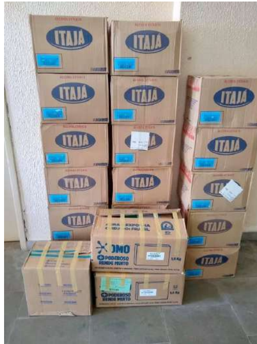
Figura 7: Doação de álcool e luvas cirúrgicas