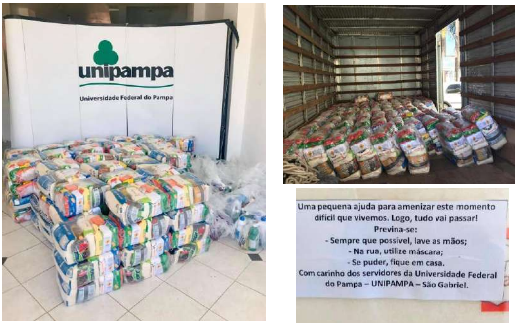
Figura 6: Doação de Cestas básicas