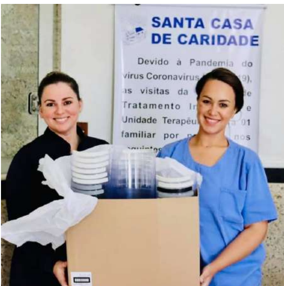
Figura 4: Face Shield Santa Casa de São Gabriel