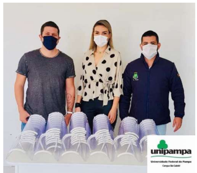
Figura 5: Face Shield município de Rosário do Sul