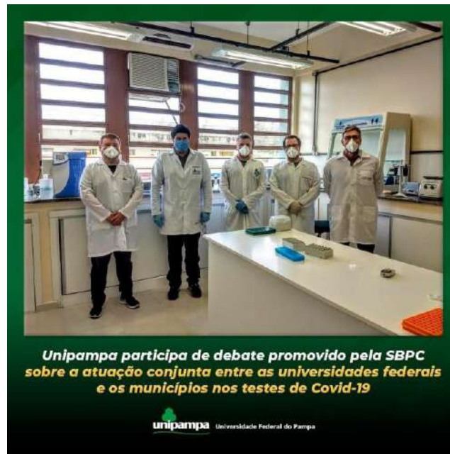
Figura 10: Professores no debate do SBPC