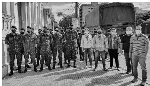
Transporte de insumos da Unipampa até a Secretaria Municipal de Saúde de Uruguaiana realizado pelo Exército Brasileiro.

A Unipampa também destinou três telefones celulares para a Secretaria Municipal de Saúde (SMS) realizar o acompanhamento de pacientes com COVID-19 e para contato com participantes da pesquisa EPICOVID.