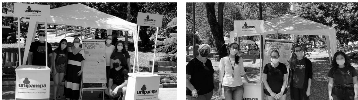
Coordenação e equipe executora do projeto Doação Voluntária de Corpos em atividade de divulgação na Praça Barão do Rio Branco - Uruguaiana.

Projetos como “Doação Voluntária de Corpos da Unipampa” foram apresentados na comunidade em atividades realizadas em locais públicos.