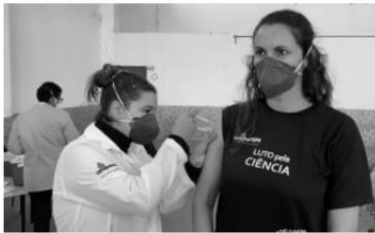
Aluna vacina professora em Uruguaiiana — foto: Henrique Dihl / RBS TV

Disponível em : https://g1.globo.com/rs/rio-grande-do-sul/noticia/2021/05/31/professora-e-vacinada-contra-a-covid-19-por-aluna-em-uruguaiiana.ghtml