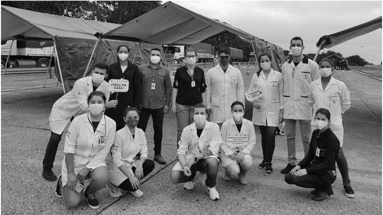
Equipe do Campus Uruguaiiana que participou de outros momentos de vacinação para a COVID-19.

As vacinas foram aplicadas conforme os grupos prioritários. Os trabalhadores do ensino superior no município de Uruguaiiana aptos para vacinação contra o novo coronavírus apresentaram-se na escola municipal Cecília Meireles, conforme organização da Secretaria Municipal de Saúde, para receber a primeira dose da vacina contra o novo coronavírus.