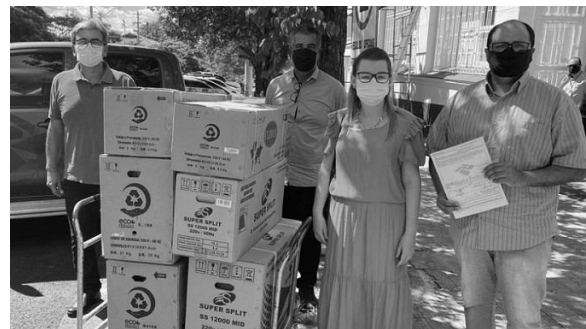
Doação de soja para nutrição animal e aparelhos de ar condicionado pela Receita Federal para a Unipampa.