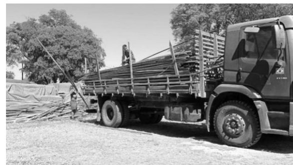
Destinação de madeiras pelo IBAMA para a Unipampa/Campus Uruguiana. O transporte das madeiras doadas para a Unipampa/Campus Uruguiana ocorreu a encargo do Exército Brasileiro.