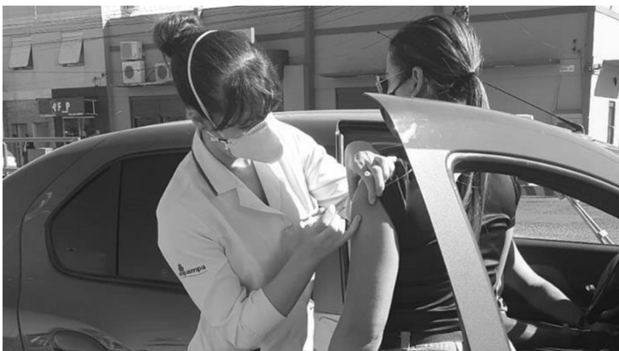
Vacinação através de Drive Thru realizada com a participação de acadêmicos da Unipampa.