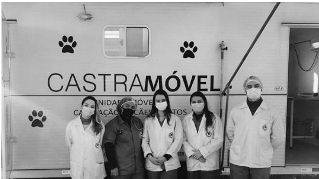
Residentes do PRIMV no projeto castramóvel.

O Programa de Residência Integrado em Medicina Veterinária (PRIMV) da Unipampa contribui com a Secretaria do Meio Ambiente, Sustentabilidade e Bem-estar Animal (SEMA) no projeto do Castramóvel.