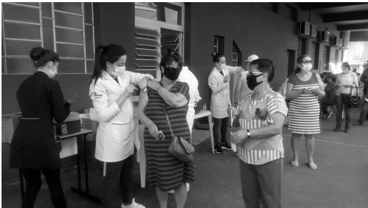
Registro da participação dos acadêmicos da Unipampa nessa etapa da Campanha de Vacinação.

A aplicação das vacinas da COVID-19 foram ações muito constantes no ano de 2021. Acadêmicos da área da saúde, especialmente do Curso de Enfermagem, e servidores da Unipampa participaram da Campanha de Vacinação para COVID-19.