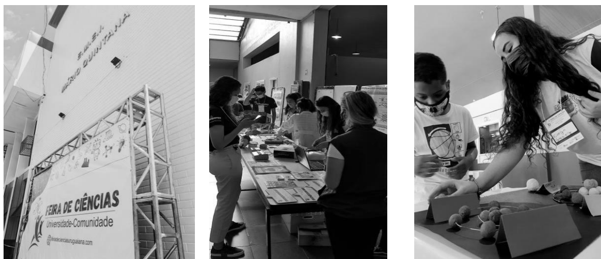
Registros da 3ª Feira de Ciências Universidade-Comunidade.

Também em parceria com a Secretaria Municipal de Educação de Uruguaiana, foi realizada a terceira edição da Feira de Ciências Universidade-Comunidade.