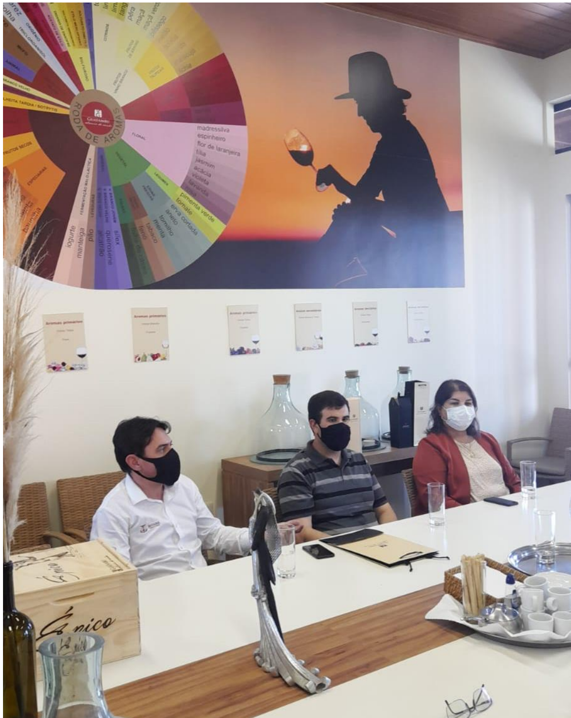
Reunião com a associação vinhos da campanha gaúcha