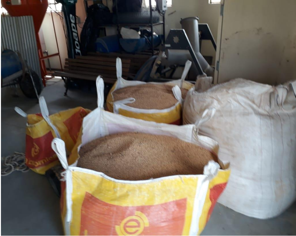
Doação de soja receita Federal