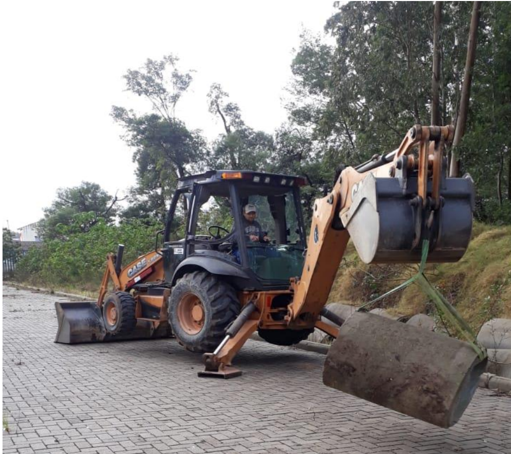
Recebimento de tubos para estância do pampa