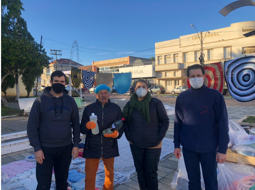
Entrega de sabonete líquido na feira livre do produtor