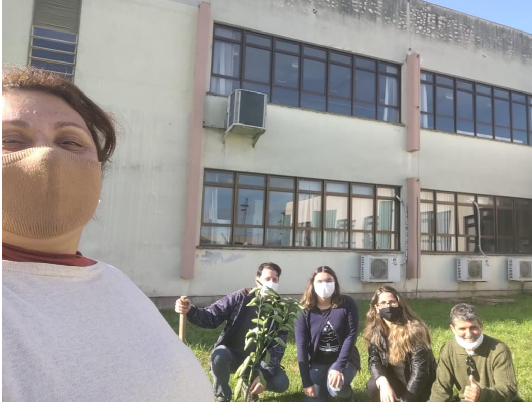
Plantio de arvores comemorando o mês de aniversário do campus