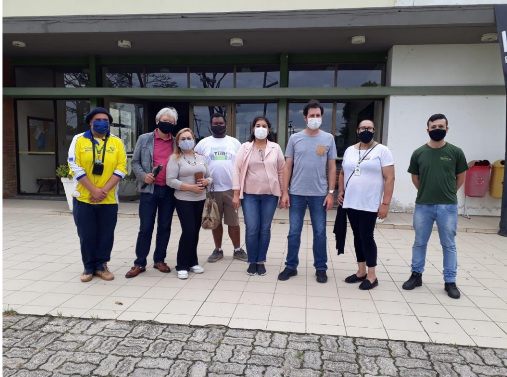
Turistas de Brasília visitando o campus