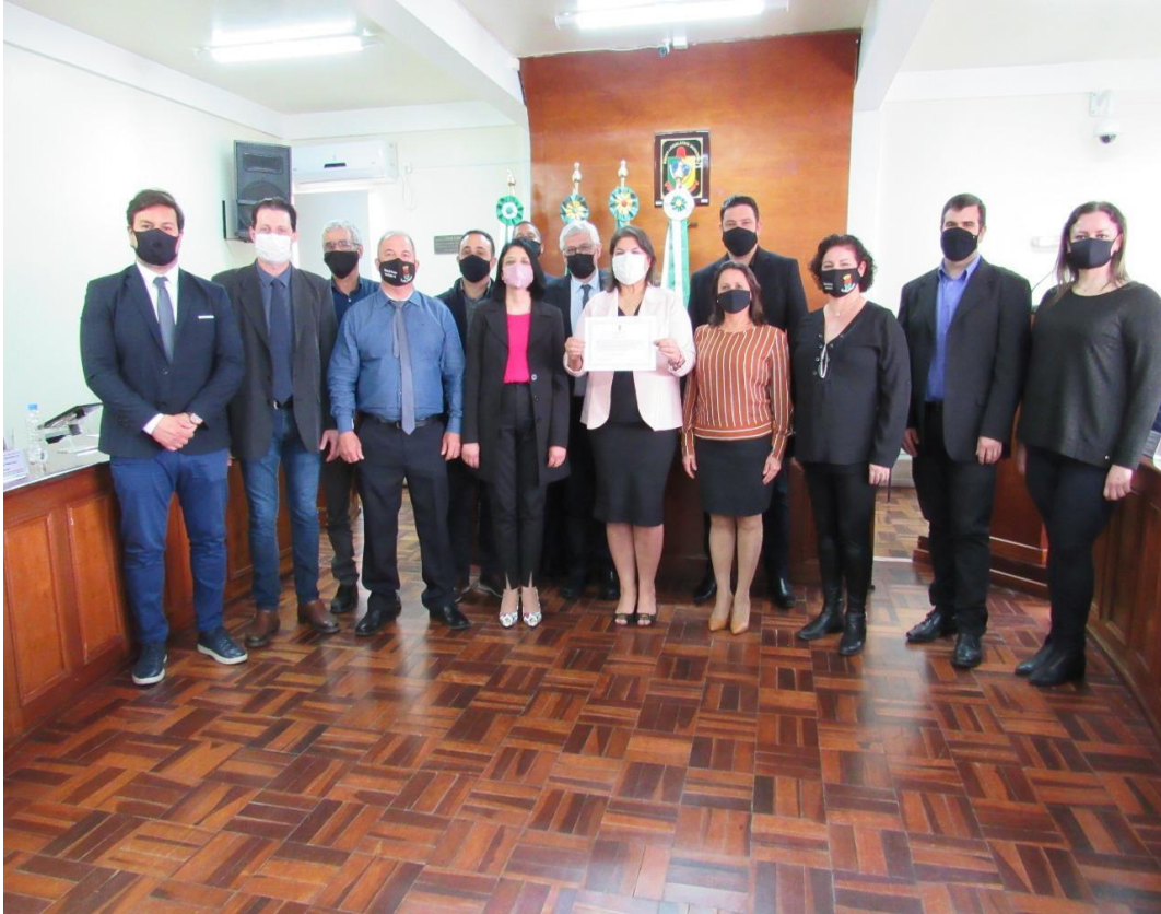
Homenagem da câmara de vereadores e entrega do voto de louvor entregue ao campus Dom Pedrito pelos seus 15 anos