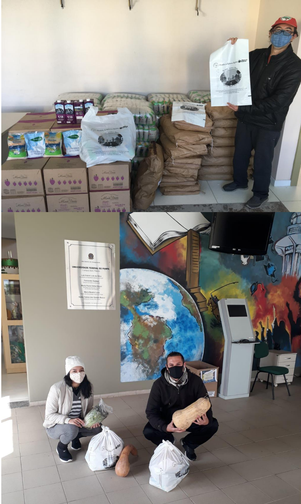
Ação solidária com entrega de Kits de produtos orgânicos