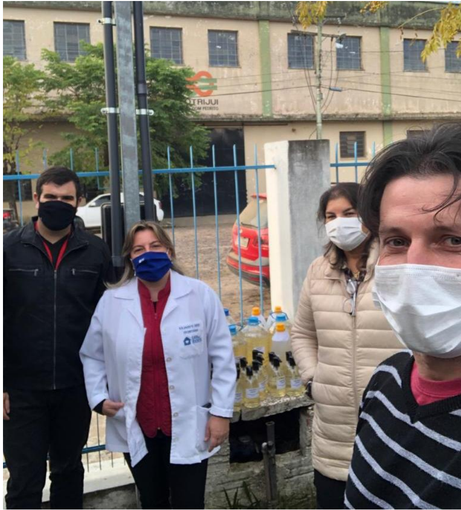
Entrega de sabonete líquido no Lar de Idosos Major Alencastro da Fontoura