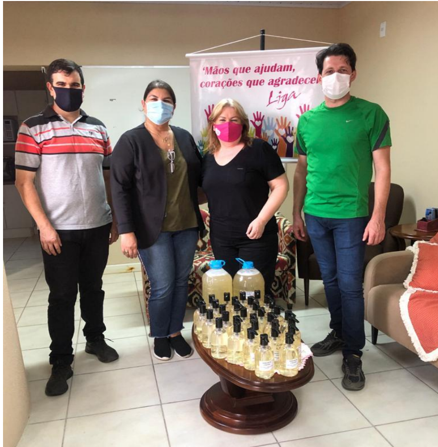
Entrega de sabonete líquido na liga feminina de combate ao câncer