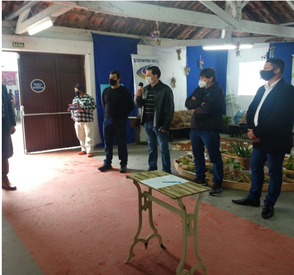
Participação da assinatura o protocolo de intensões entre a prefeitura municipal e FARGS