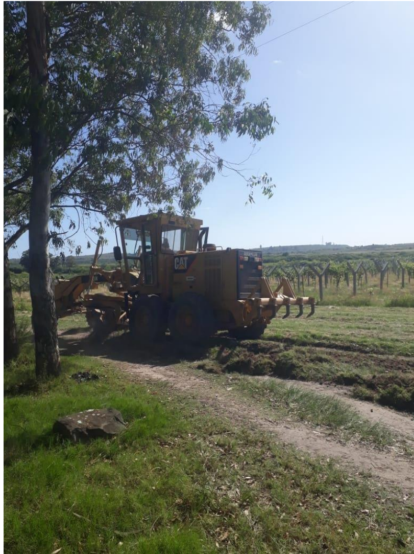
Arruamento estância do pampa com apoio da prefeitura municipal