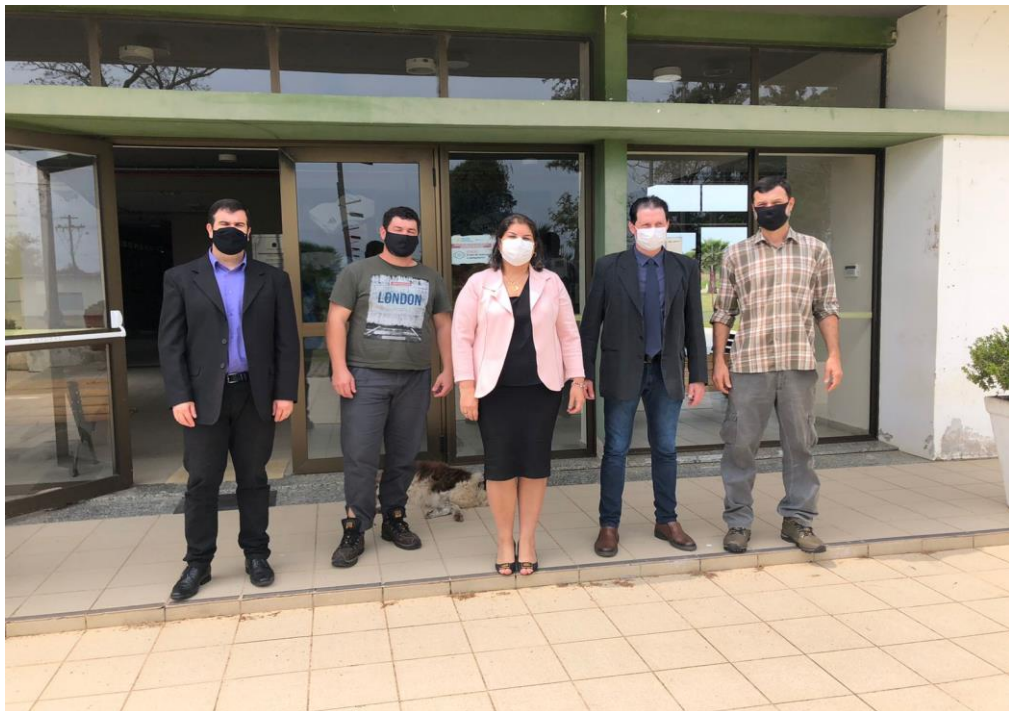
Reunião com produtores de Mel do município