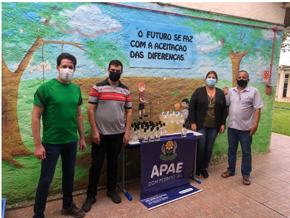
Entrega de sabonete líquido na APAE