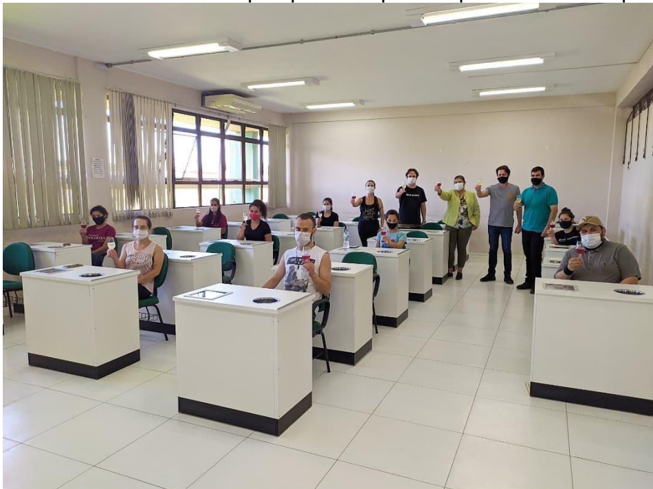
Inauguração do laboratório de análise sensorial