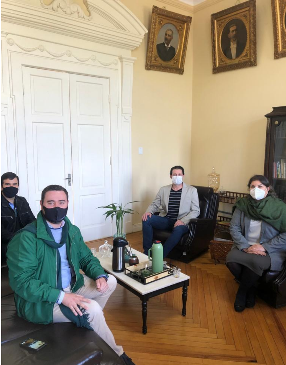
Visita prefeitura municipal e reunião com o prefeito Mario Augusto