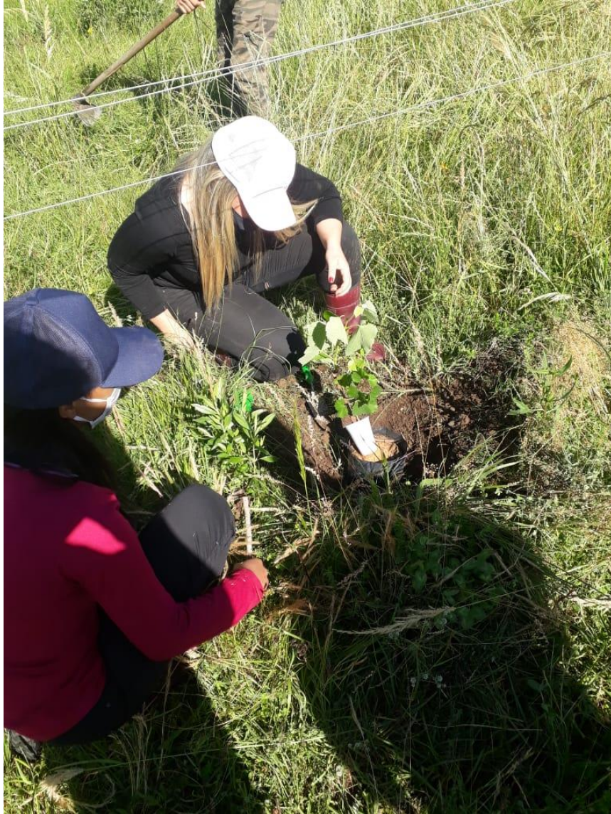
Plantio de mudas no vinhedo orgânico na Estância do pampa