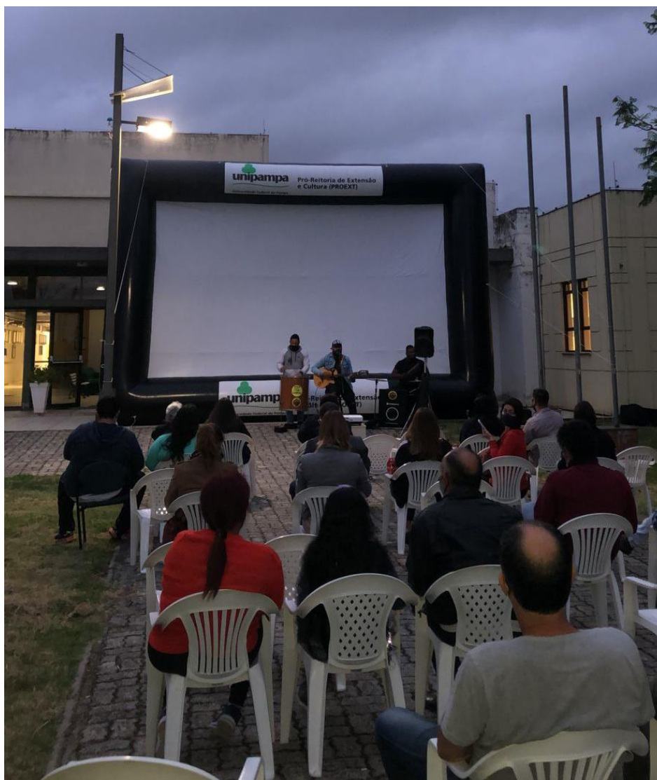
Sessão de cinema especial para a Comunidade.