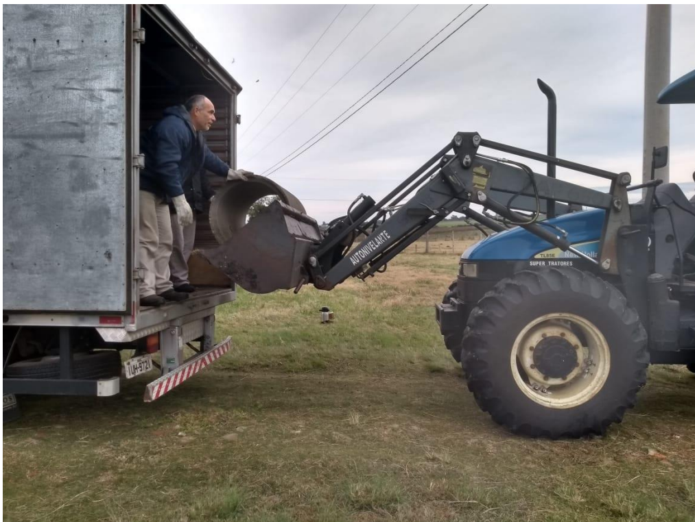
Recebimento de tubos para estância do pampa