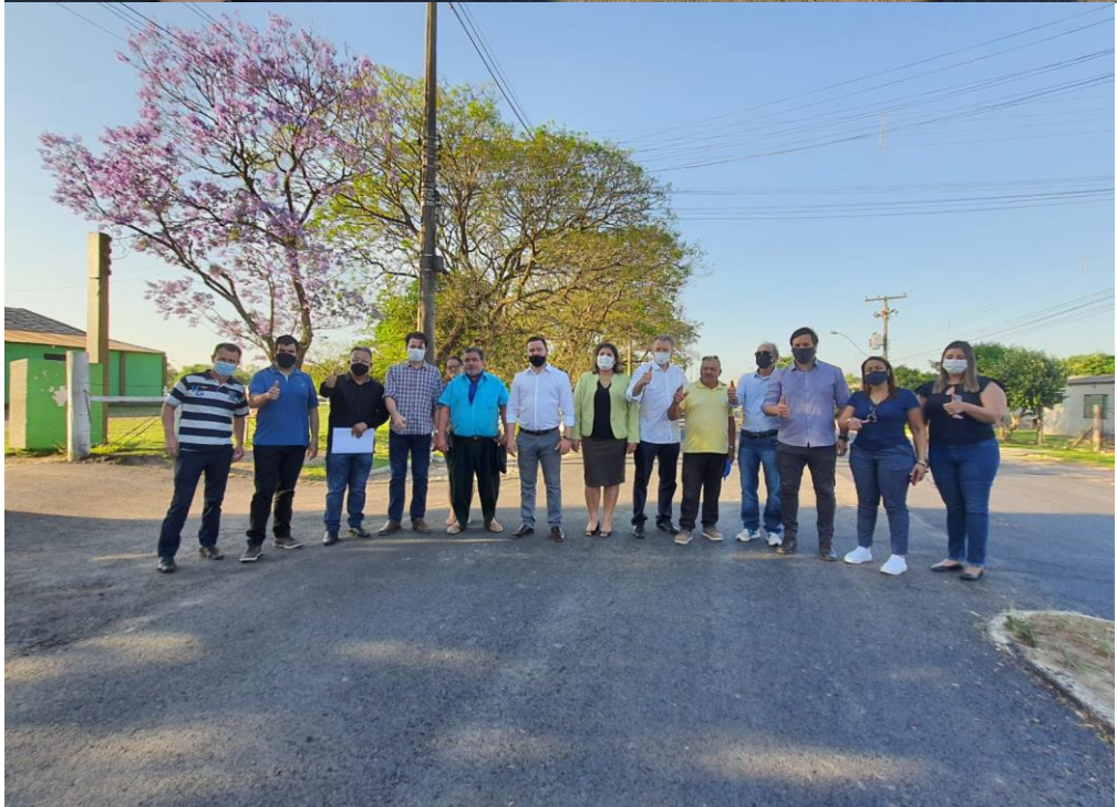
Entrega da obra do asfalto da Rua 21 de abril com acesso ao campus