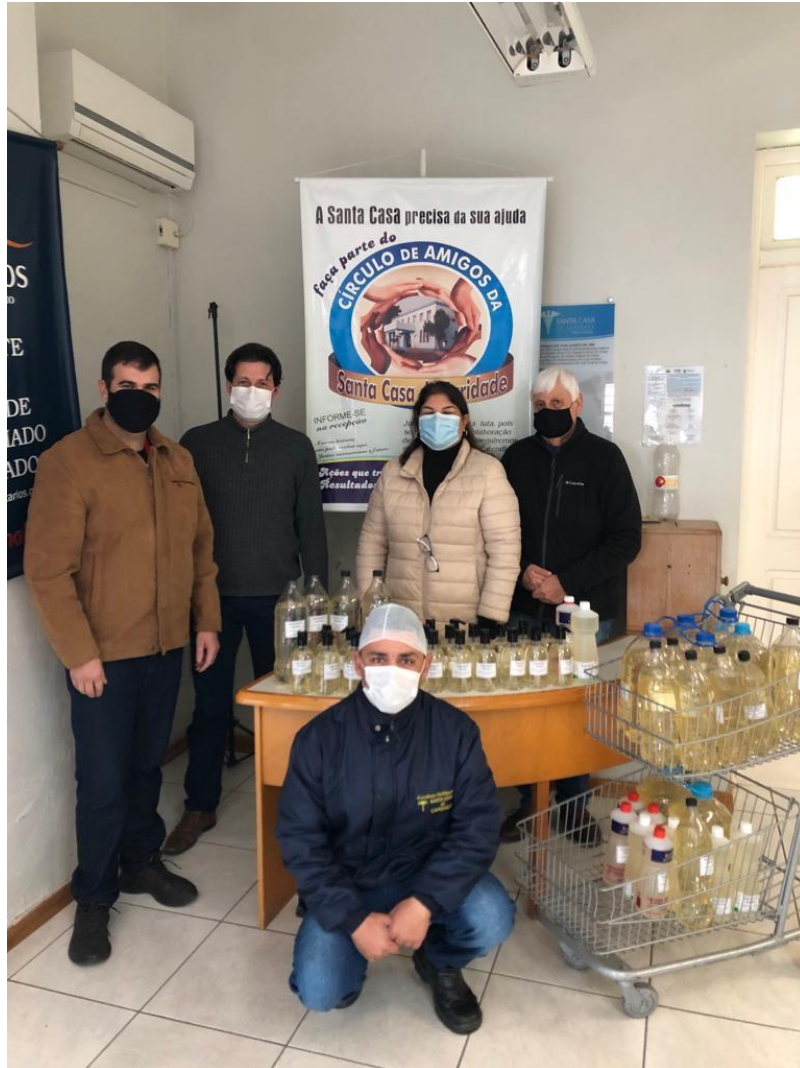
Entrega de sabonete líquido na santa casa de caridade