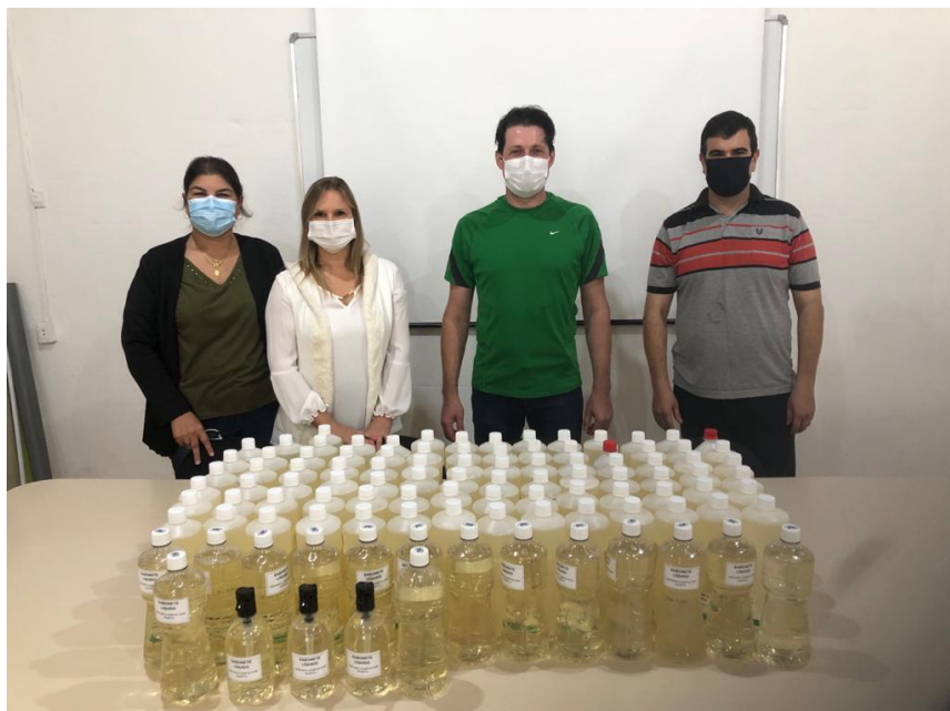
Entrega de sabonete líquido na secretaria do trabalho e assistência social