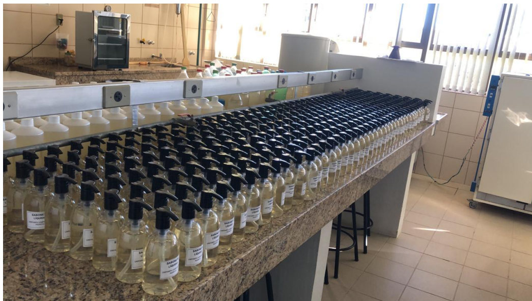
Produção de sabonete líquido no laboratório do campus

No ano de 2021 as atividades presenciais foram limitadas, devido ao contexto da pandemia, no entanto, no começo do ano tivemos a abertura do Tempo Universidade e também a produção de sabonete líquido, imprescindível na manutenção dos procedimentos de segurança na prevenção ao Covid 19. Foram realizadas diversas campanhas para auxílio aos alunos e comunidade externa, representada por diferentes entidades filantrópicas, Conforme os registros fotográficos a seguir: