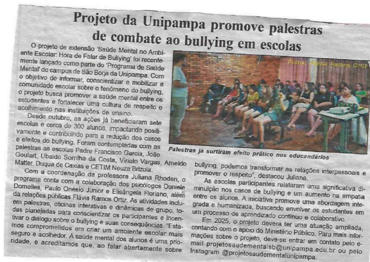
Figura 10: Divulgação de campanha de conscientização sobre o bullying nas escolas

Fonte: Jornal Folha de São Borja , 7 de dezembro de 2024.