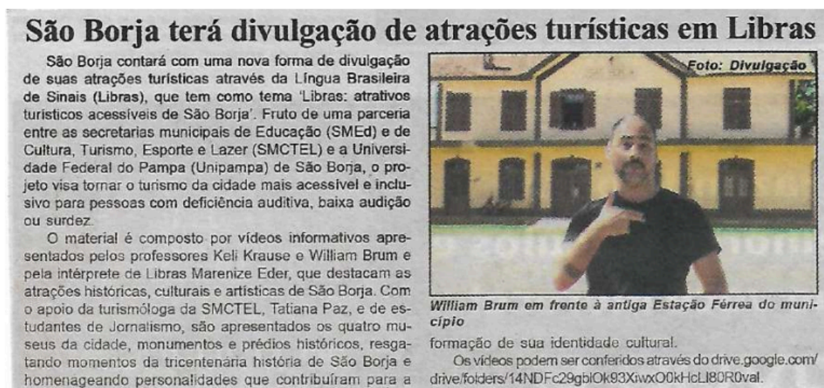
Figura 9: Divulgação do projeto Atrativos turísticos acessíveis em LIBRAS