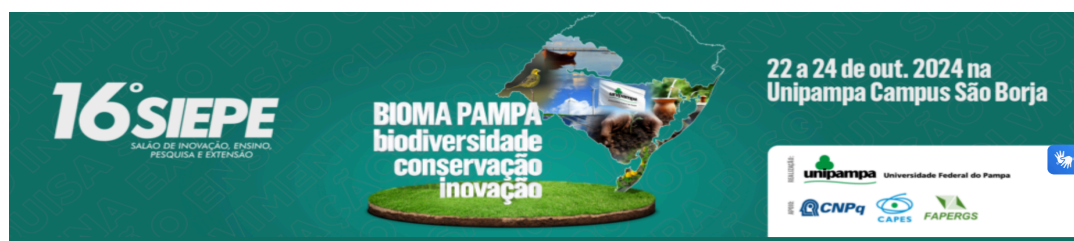
Figura 6: Divulgação do 16ª edição do SIEPE