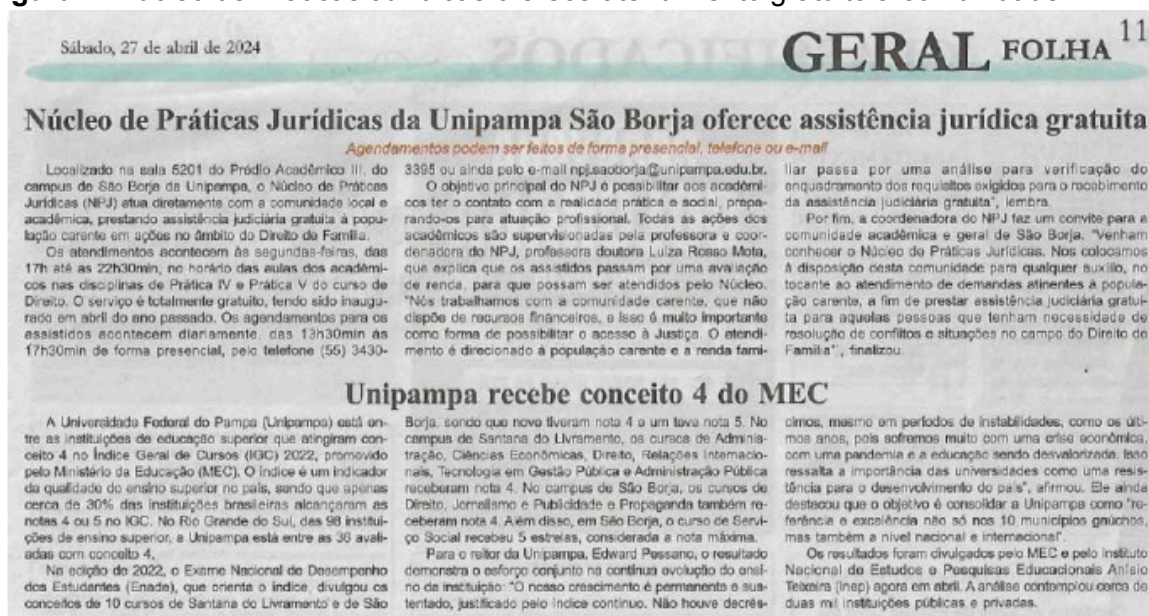
Figura 1: Núcleo de Práticas Jurídicas oferece atendimento gratuito à comunidade