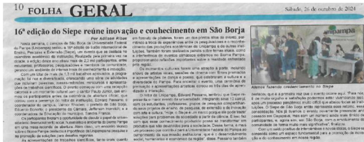
Figura 8: 16ª edição do SIEPE reúne inovação e conhecimento em São Borja