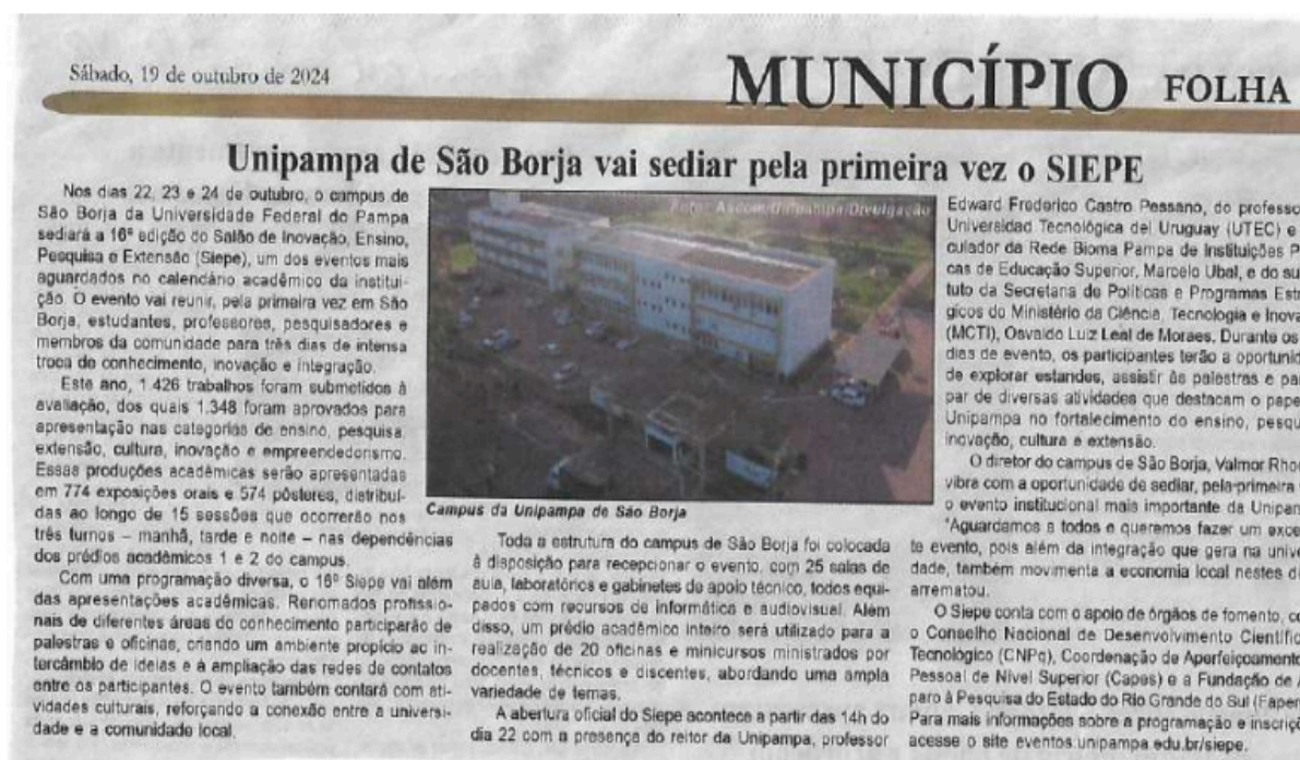
Figura 7: Divulgação do 16º SIEPE nos meios de comunicação locais