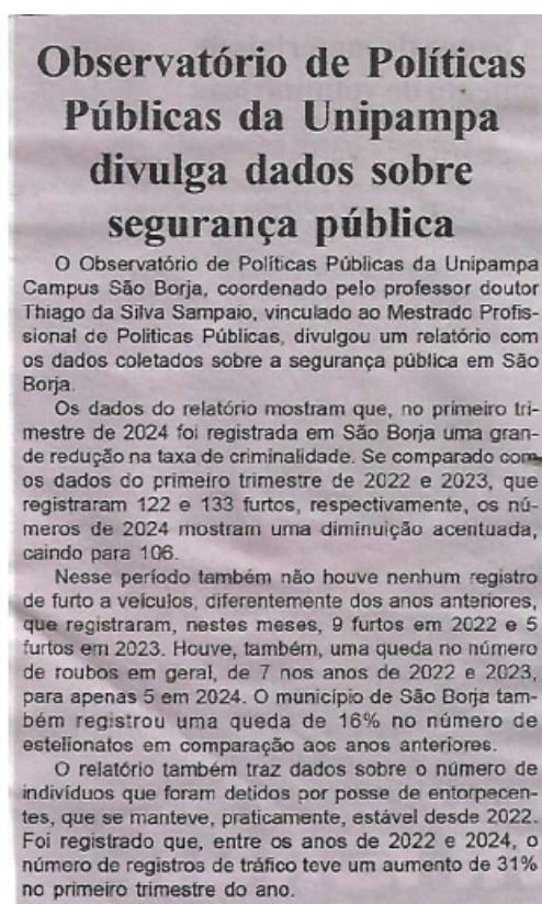
Figura 3: Divulgação de pesquisa sobre a segurança pública no município