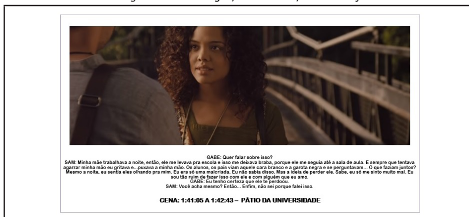
Imagem 8 – Ser negro, ser branco, ser mestiço?