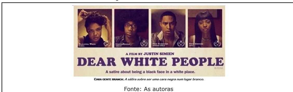
Imagem 1 – Cara Gente Branca

A obra DEAR WHITE PEOPLE (Cara Gente Branca) do estadunidense Justin Simien torna-se, nos tempos atuais, glocalmente relevante para se compreender as relações entre pessoas percebidas como brancas, negras e mestiças em sociedades multiculturais globais e locais. Apesar do conteúdo audiovisual ser originário dos Estados Unidos da América (EUA), as visibilidades e invisibilidades midiáticas construídas pela ideologia do racismo e suas relações entre o simbólico e o social (HALL, 2018) permeiam as culturas brasileira e a estadunidense, entre outras, onde ser negro/a (preto ou pardo) acaba tendo implicações nas mobilidades sociais.