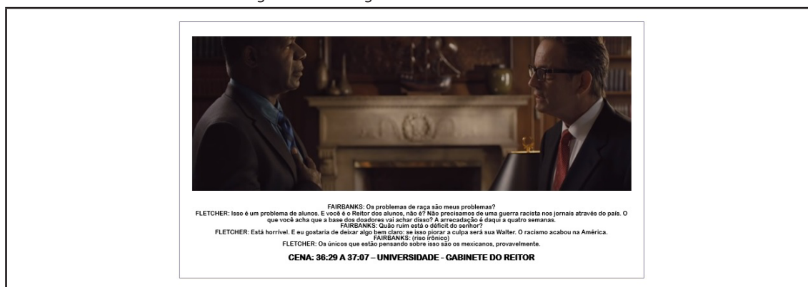
Imagem 3 – Diálogos entre Fairbanks e Fletcher